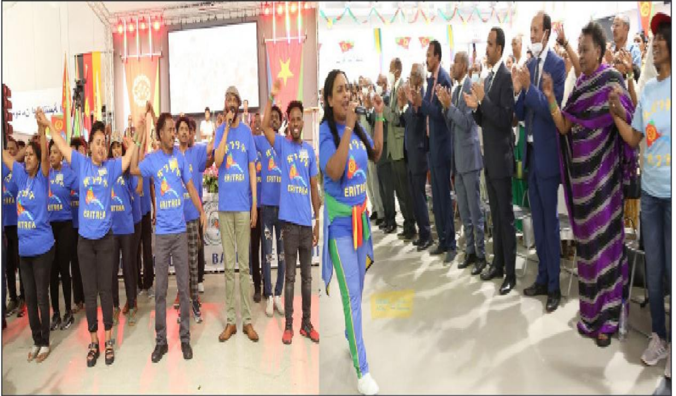
Eritrea Festival in Deutschland 2022