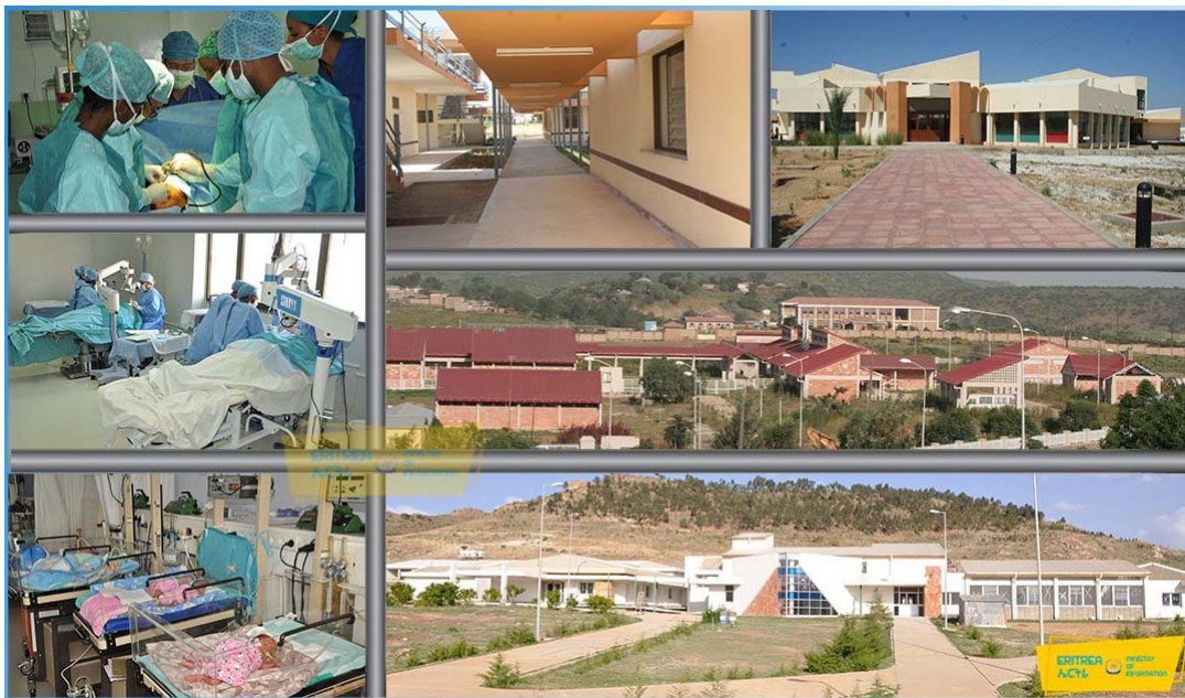
Gesundheitsversorgung in abgelegenen Gebieten

Kampfes versorgten Barfuß-Ärzte und andere Gesundheitsarbeiter Flüchtlinge und Zivilisten und waren natürlich ein wichtiger Teil der Befreiungskräfte. Ohne die zahllosen qualifizierten, kompetenten und engagierten Gesundheits- und Pflegekräfte im ganzen Land wären nur wenige, wenn nicht gar keine der bedeutenden Errungenschaften Eritreas in Bezug auf gesundheitsbezogene Entwicklungen möglich gewesen - wie zum Beispiel die Tatsache, dass es eines der wenigen von den Entwicklungsländern war, das in die Periode der nachhaltigen Entwicklungsziele der Vereinten Nationen eintrat und die meisten der Millenniumsentwicklungsziele im Bereich Gesundheit erreicht hat. Natürlich sind die Gesundheits- und Pflegekräfte unseres Landes im vergangenen Jahr an der Spitze des herausfordernden Kampfes gegen die COVID-19-Pandemie geblieben und haben große Professionalität und Hingabe gezeigt. Letztendlich ist die Tatsache, dass Eritrea trotz der jüngsten und besorgniserregenden Zunahme positiver Fälle eine allgemein erfolgreiche Reaktion auf die Pandemie hatte, was in erheblichem Maße auf das bloße Engagement und den Einsatz seiner Gesundheits- und Pflegekräfte zurückzuführen ist.