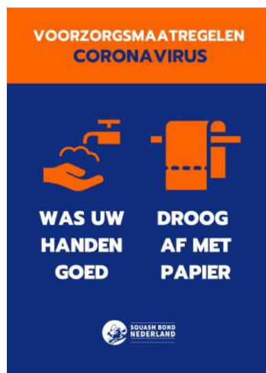
Deurposter bij ingang

Vervolg communicatie-uitingen squashcentra