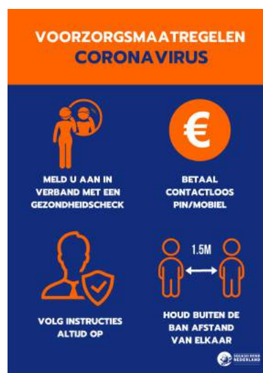
Bij aanmelding aan balie