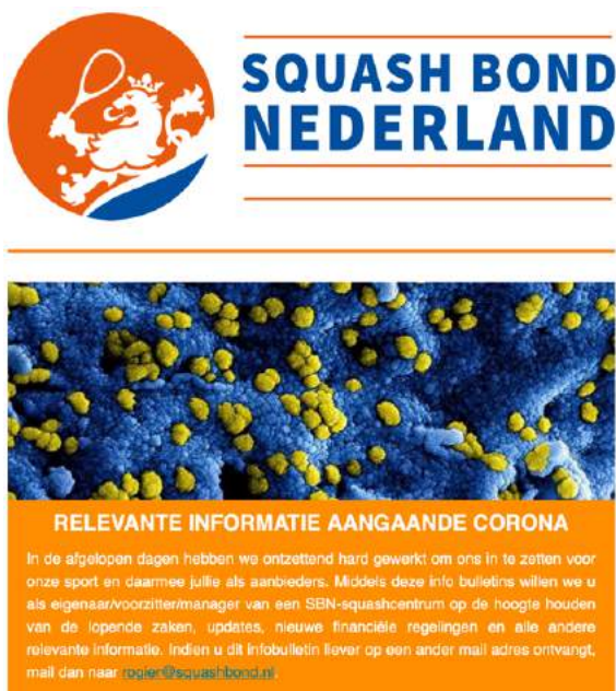
Informatiebulletin SBN Centra

In deze fase overweegt een squasher weer op individuele basis te gaan squashen en kijkt hiervoor op de website van zijn/haar squashclub om de baan te reserveren. Op deze website zijn bijvoorbeeld onderstaande uitingen zichtbaar en deze verwijzen naar een pagina waarop alle door het centrum genomen relevante maatregelen voor squashers inzichtelijk zijn.