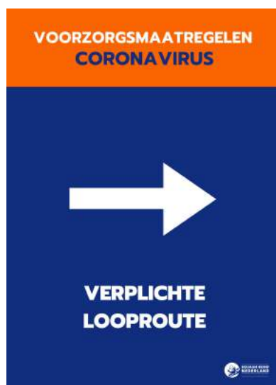
Posters t.b.v. looproute