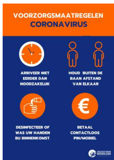
Deurposter bij ingang

Indien een squasher arriveert op het centrum, zal hij/zij (of X) - indien dit van toepassing is -nogmaals de triagevragen beantwoorden. Daarnaast dient er informatie voorziening plaats te vinden door medewerker(s)/vrijwilliger(s) en door SBN-communicatie uitingen, zodat de squasher zich kan houden aan de geldende maatregelen conform protocol. Zie hiervoor de verschillende communicatie uitingen waarmee een squasher in aanraking komt tijdens het bezoek: