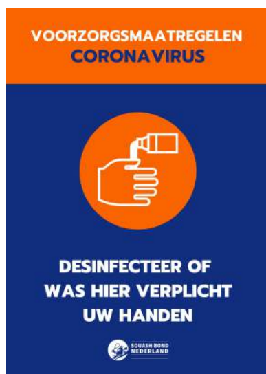
Bij binnenkomst (en in centrum)