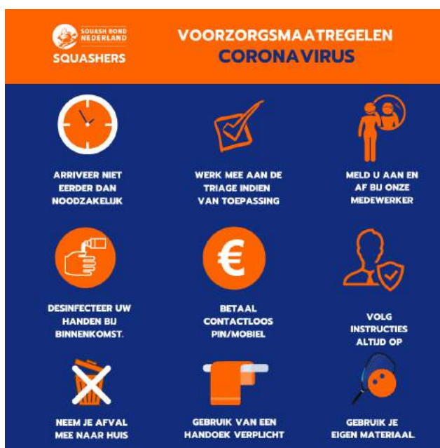
Voorbeeld uiting Social Media