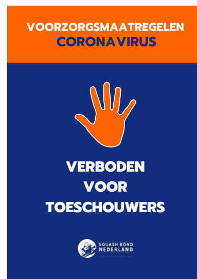
Bijv. voor kleine ruimtes

Tegelijkertijd wil SBN dat centra haar medewerkers zo goed mogelijk instrueren. Hiervoor is een instructiekaart gemaakt waarop in één overzicht alle belangrijkste/relevante maatregelen en rechten/plichten van de medewerker staan. Dit vergemakkelijkt de uitvoering. De versie die centra ontvangen is van 12 juni. Via de toolkit op de website van Squash Bond Nederland is de meest actuele versie terug te vinden: