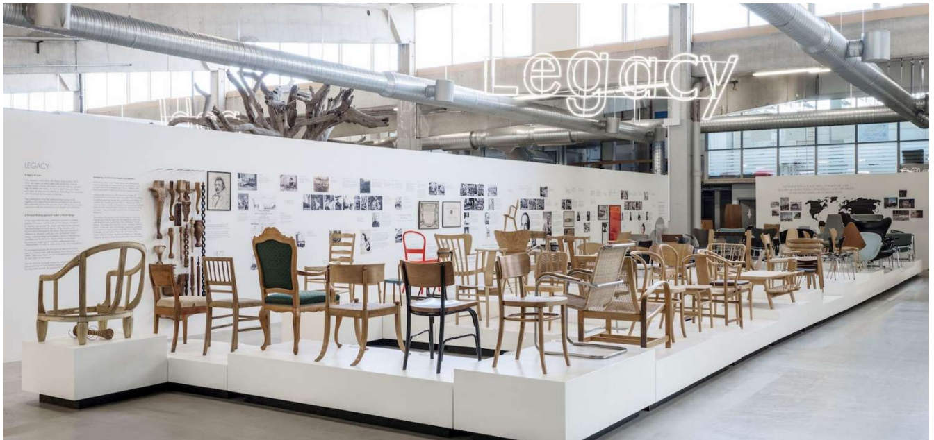
Foto fra tidligere udstilling.

Mødested: Fritz Hansen, Hovedindgangen, Allerødvej 8, 3450 Allerød.