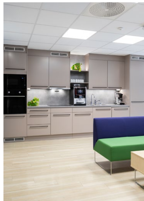
Felles sosial sone og kjøkken tilrettelegger også for mer samhandling og samvær. Ansatte beskriver at lokalene gir økt mulighet for smidig og lettbeint samhandling, og at oppgaver som tidligere ble løst i tlf, e-post og møter i dag løses umiddelbart på stedet.