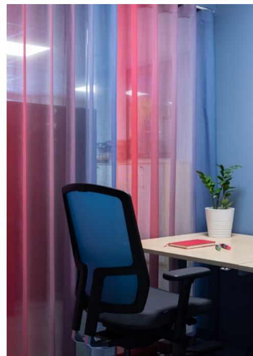
Alle stillerom har fått blå stoler for å markere rullerende bruk og at dette ikke skal brukes som kontor. Arbeidsbordene hadde bydelen fra før. Stillerom har fått lette gardiner som kan trekkes for når de er i bruk. Tekstilet myker opp og luner rommet, demper akustikk, tilfører farge i lokalet. Det gir ro og trygge rammer for ansatte i en krevende arbeidsdag.