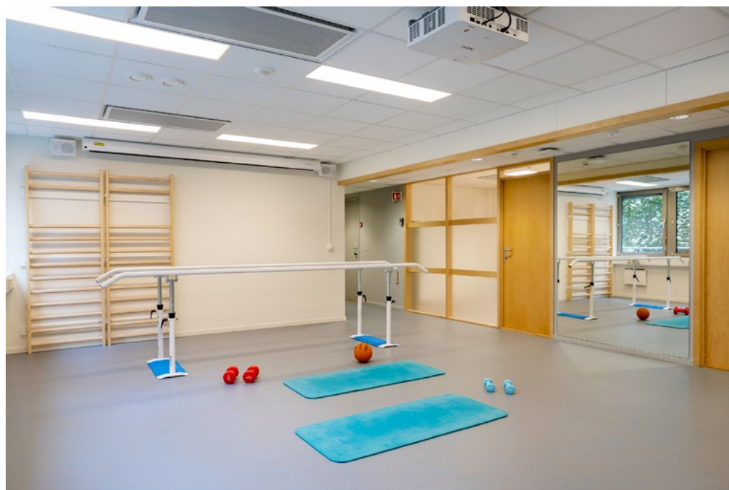
Multifunksjonsrommet brukes til kurs- og konferansesenter, bydelsutvalgsmøter og større samlinger, og som treningsrom for bydelsens innbyggere (Friskliv). Det fremmer også sambruk mellom bydelsens mange avdelinger.

I seks måneder jobbet interne medarbeidere tett med interiørarkitekt for å kartlegge, sortere, merke og planlegge