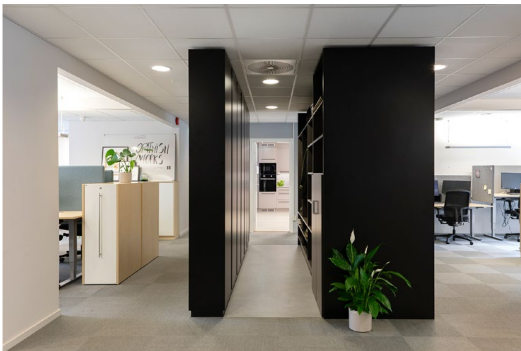
Åpent landskap var her eneste løsning med tanke på plass og ønsket om faglig dialog på tvers av avdelinger. Spesialdesignet innredning fra gulv til tak skjærer for støy og fyller behov for tilstrekkelig oppbevaring og garderobe for de ansatte.