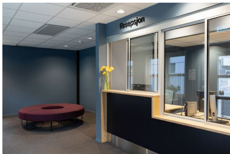
En ny fellesresepsjon for hele bydelen ble etablert med ønske om å ta imot brukere på en tydelig og hyggelig måte. Resepsjonen skulle ha et imøtekommende og åpent uttrykk og være UU. Samtidig var det viktig å ivareta de ansattes sikkerhet, derav glass.