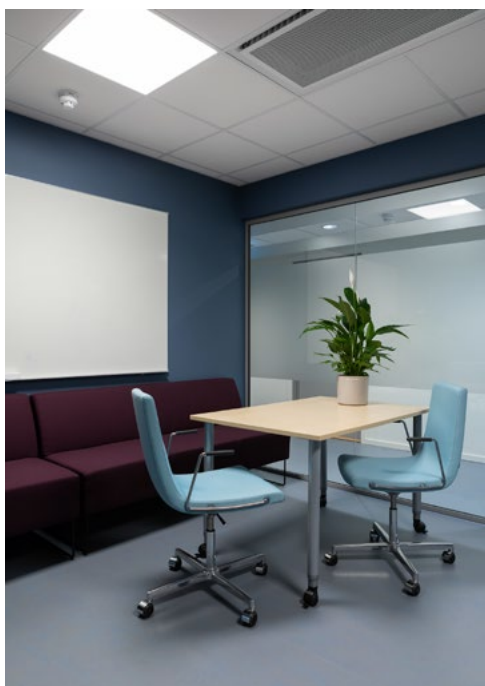
I kreativt møterom ønsket bydelen et lekent, uformelt preg. Rommet brukes også til venterom for Helsestasjon for ungdom to kvelder i uken, og behovet for fleksibilitet la føringer for møbleringen. Bordet med hjul hadde bydelen fra før, sofaene er nye, mens stolene er kjøpt brukt.

at kjerneområdene markerer funksjoner og er lysegrå, mens kontaktpunktene som minikjøkken, kaffestasjoner og kopi/print er i en blåsort farge. Møterom og rapportrom, samt sosial sone får blåtoner for å markere annen bruk og større grad av interaksjon. Bydelen jobber selv videre med å implementere dette interiørkonseptet i lokalene som ikke ble pusset opp.