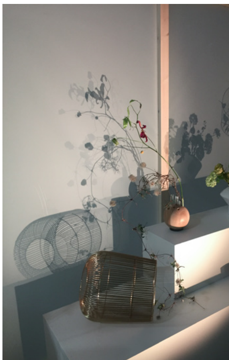
Skillet mellom interiør og natur viskes ut.