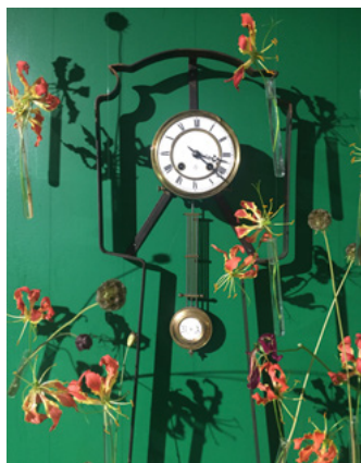
Lette gloriosa leker i rammen til vegguret.