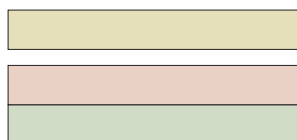
Myk Grønn madrass nederst