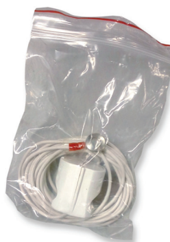
Jordingskabel + kontak