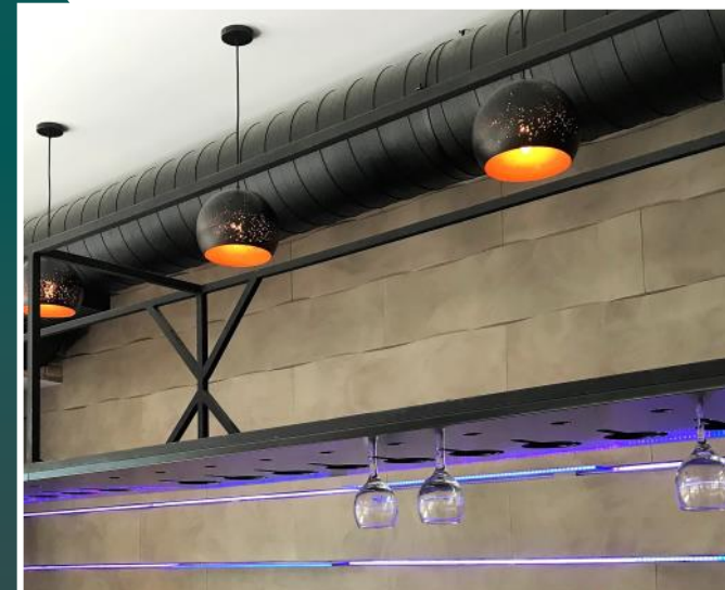
Pannello Ondular 120-40