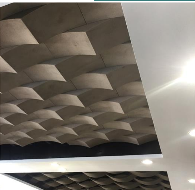
Pannello Goccia 90-30