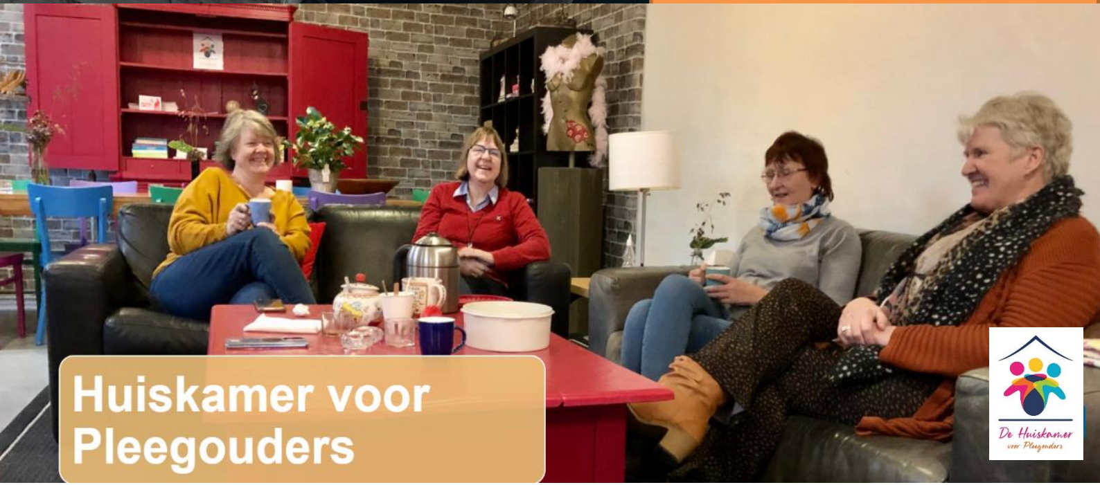
Huiskamer voor Pleegouders