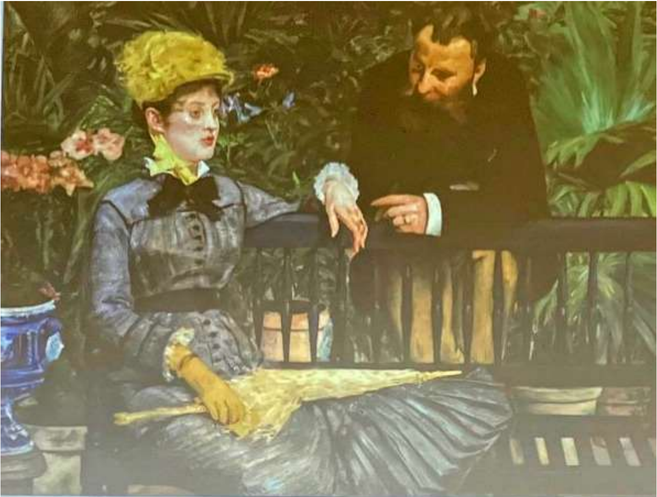
Manet, Dans la serre , 1879. Berlijn, Alte Nationalgalerie.