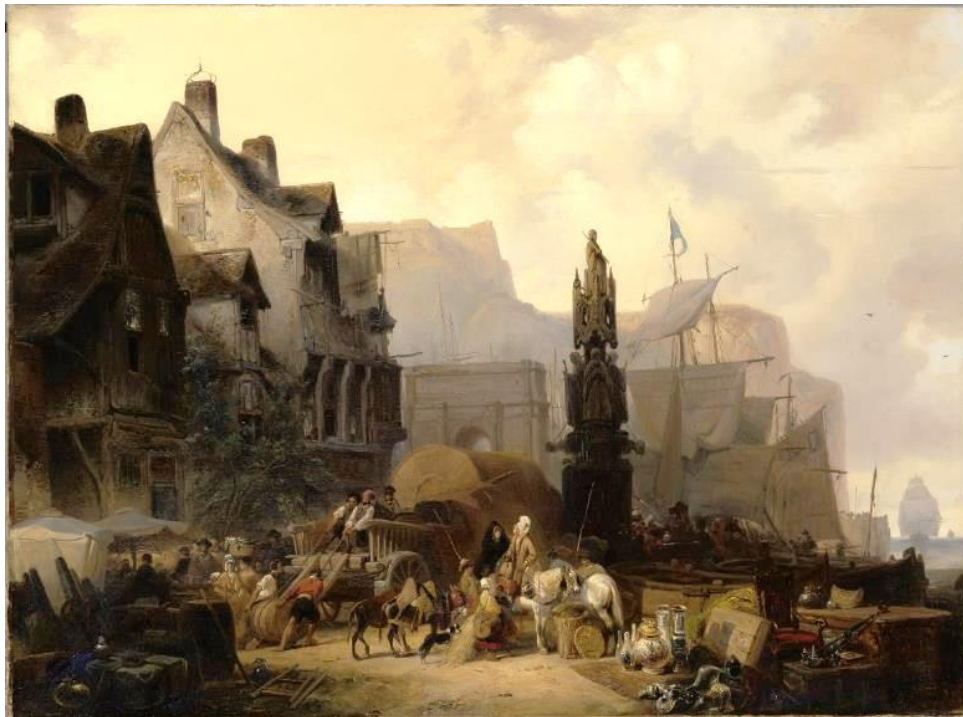
Drukke haven in Normandië van Wijnand Nuijen

(Tekst overgenomen van de website van het Dordrechts Museum)