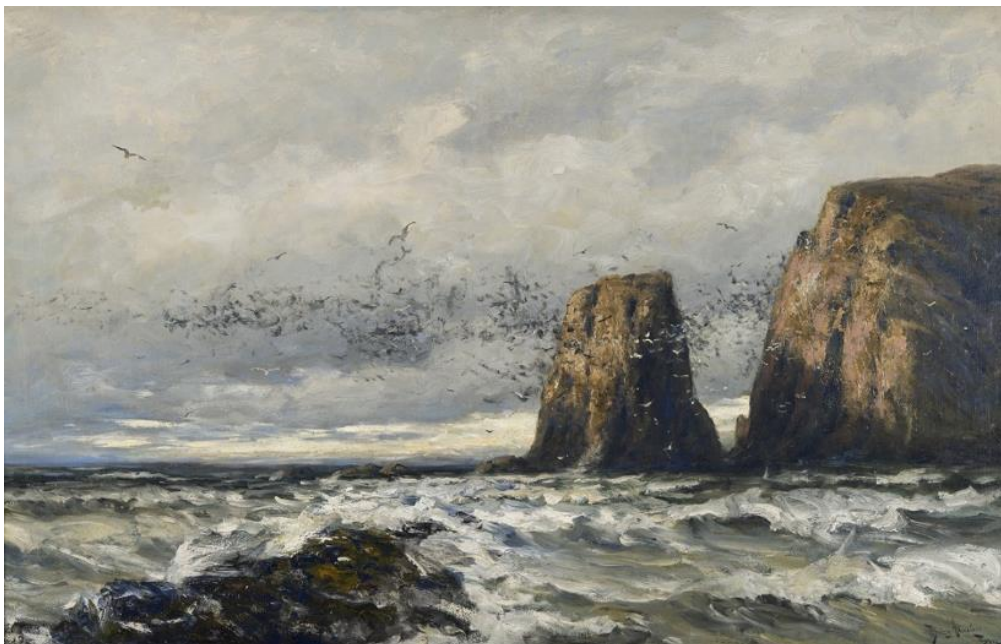
Fugola rots van Betzy Berg