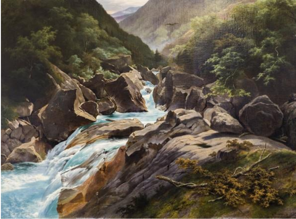
Woeste stroom in berglandschap van Louwrens Hanedoes

Ben je een kunstenaar die ook graag reist, dan is de expositie "Wanderlust" wellicht iets voor jou. Inspiratie opdoen voor een schilderij over een gemaakte of toekomstige reis.