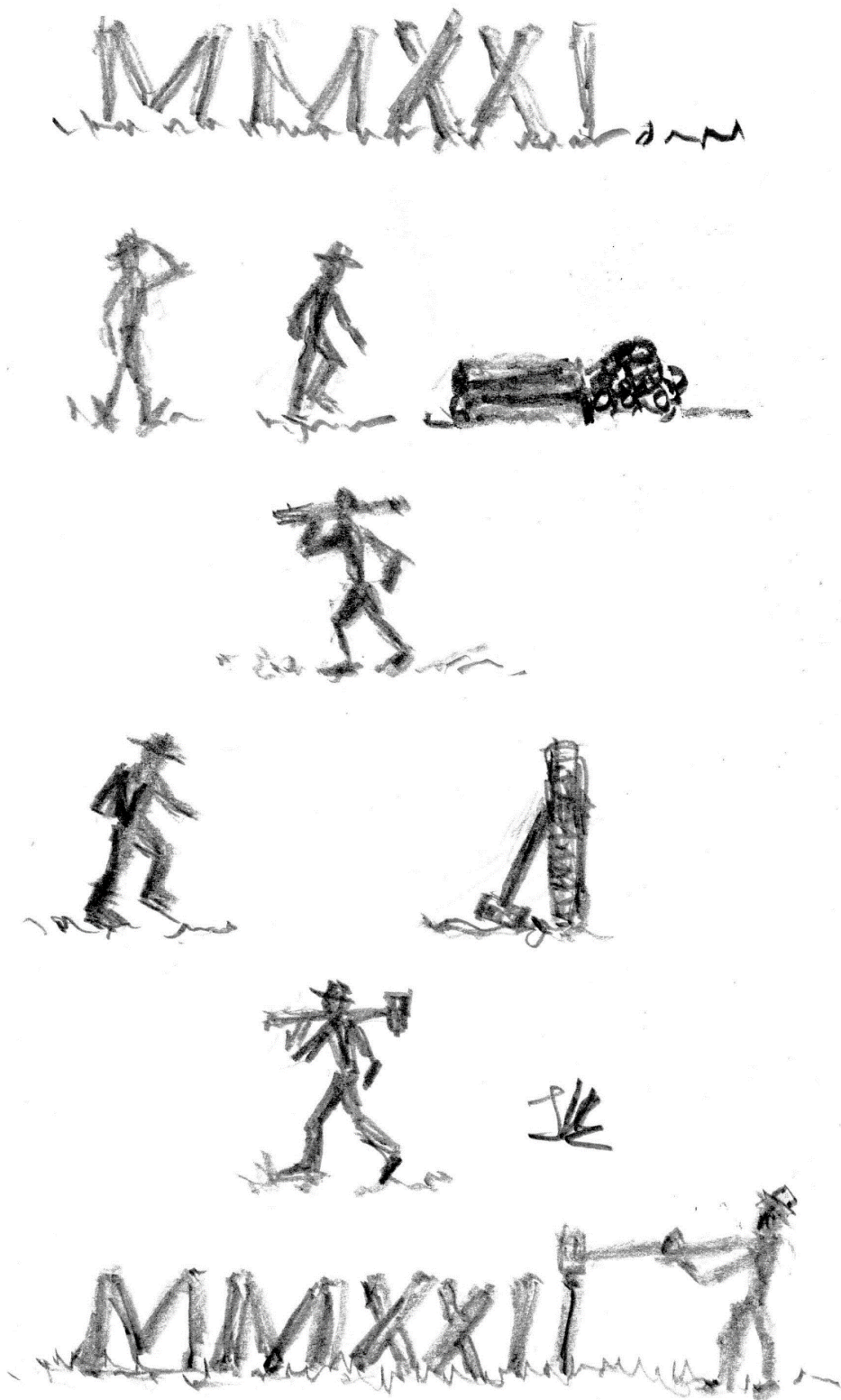
Figuur 5, strip gemaakt door Jasper

De redactie wenst een ieder alle goeds voor de toekomst en blijvend veel leesplezier.