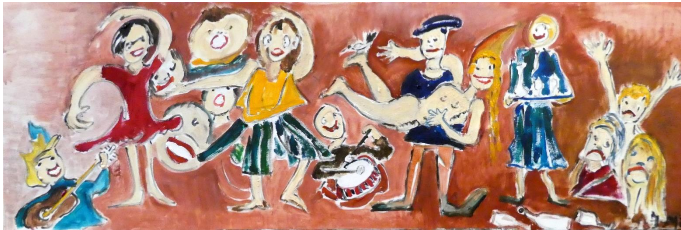
Figuur 2, Joke Mieloo

De donderdagavond ervoor waren er schetsen op kleiner formaat gemaakt voor een goede vlakverdeling. Er waren afbeeldingen van schilderijen uit de jaren vijftig, die tot het maken van een vrolijk schilderij inspireerden. De resultaten zijn in de afbeeldingen te bewonderen.