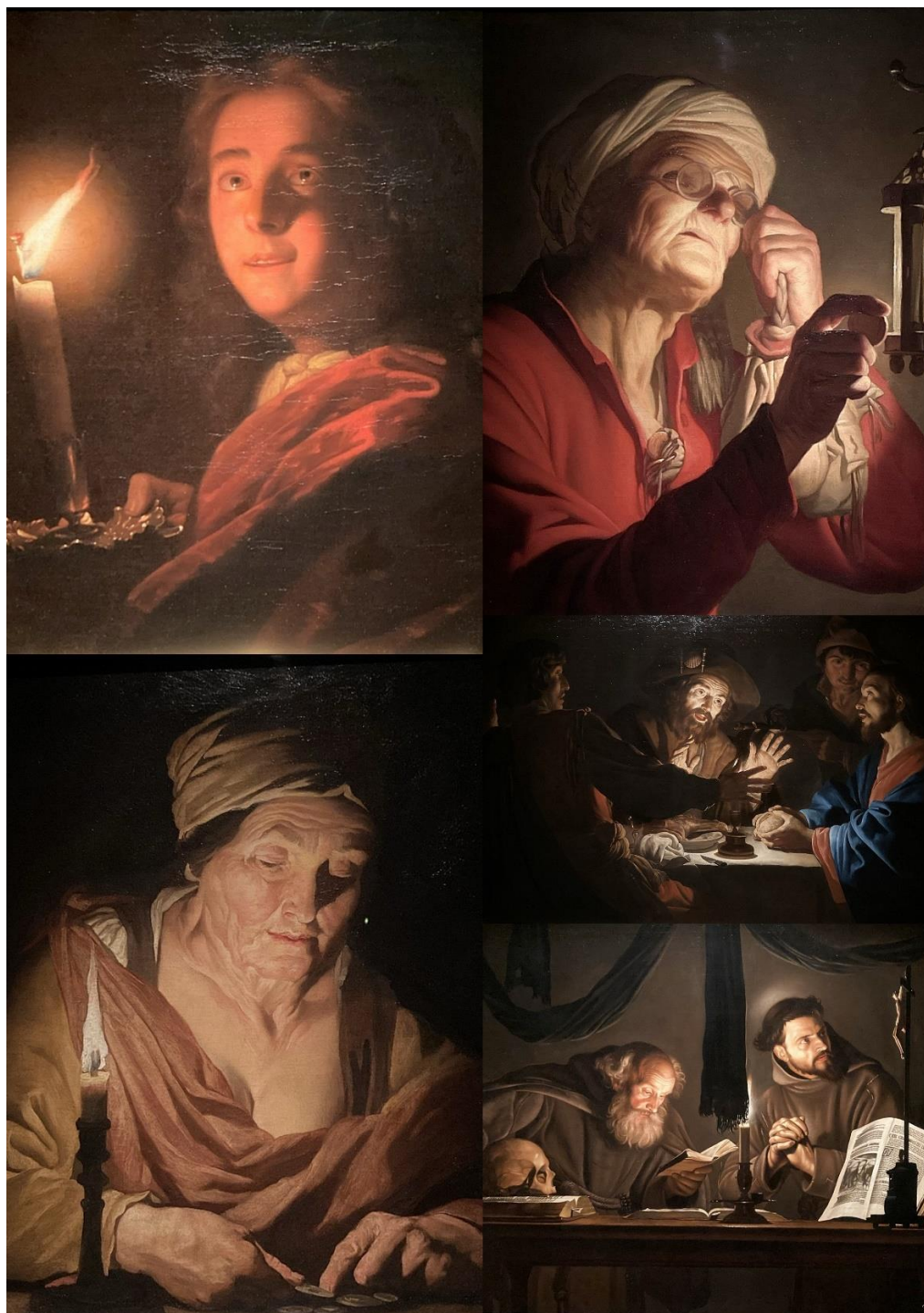
Figuur 4, De lachende jongeman bij kaarslicht is van Godefridus Schalcken

Nadat in de eerste ruimte voldoende plek is, worden we door een vriendelijke suppoost binnengelaten. En dat is dan even wennen. Je stapt namelijk een donkere, uitsluitend door kaarslicht verlichte ruimte binnen. De geëxposeerde werken komen bij deze opzet geweldig tot hun recht. Hieronder enige voorbeelden.