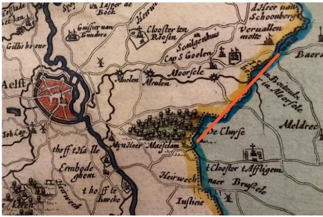
Foto: kaart van Sanderus en fragment uit de huidige kaart van Aalst.