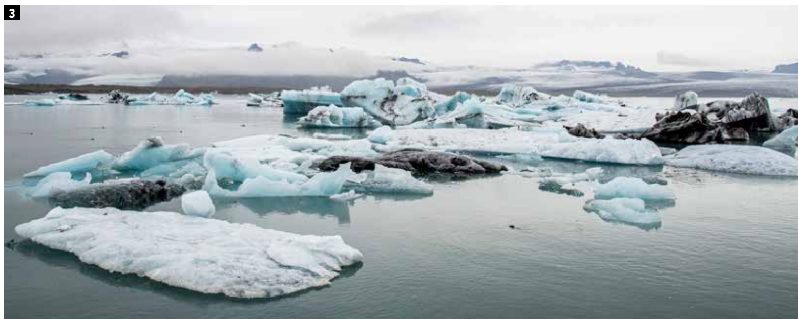
1 De Hallgrímskirkja in Reykjavik is de grootste kerk van IJsland. 2 Diamond Beach is een zwart strand bezaaid met stukjes ijs in wonderlijke vormen. 3 Een machtig zicht: de ijsschotsen op het Jökulsárlón-gletsjermeer.

optie, en zorgt voor het meeste vrijheid, zeker als je kiest voor de Campingcard. Reserveren is niet nodig, je vindt altijd wel een plekje en al zeker als je buiten het hoogseizoen reist. Ter plaatse betaal je enkel nog een toeristentaks en eventueel gebruik van extra faciliteiten zoals stroom. Zeker wanneer je voor een langere periode rondtrekt, is de kampeerkaart de ultieme vorm van besparing.