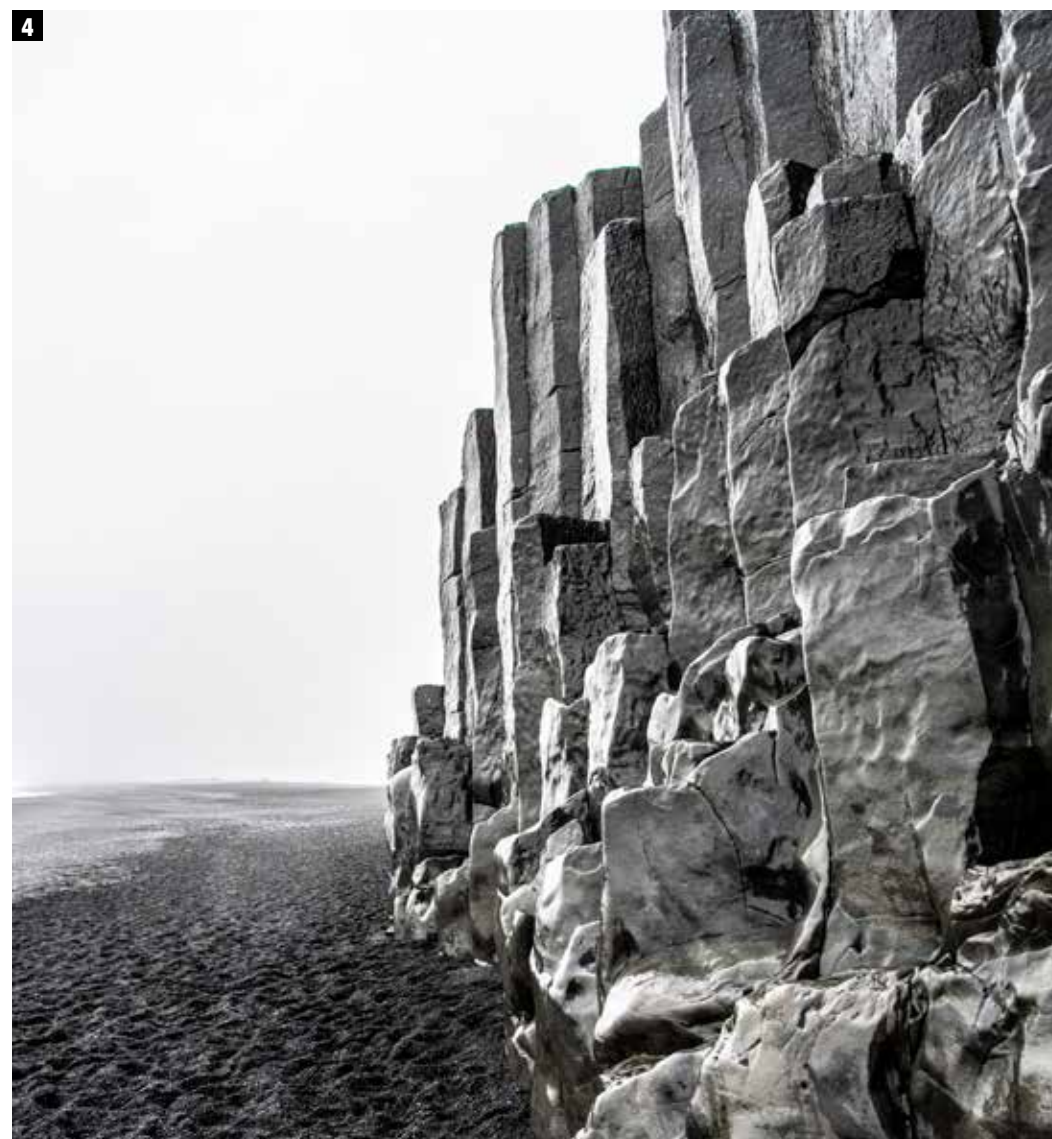
4 Een zwart-witfoto? Nee, zo ziet de basaltformatie op het zwarte strand van Reynisfjara er gewoon echt uit.

“ Zeehondjes buitelen speels tussen blauwe ijsschotsen. Dit is het bijzonderste wat ik ooit heb gezien.”