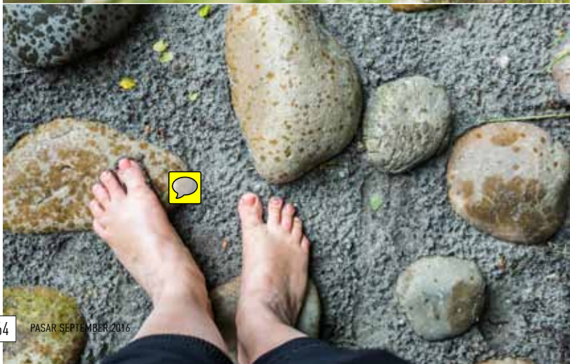
PASAR SEPTEMBER 2016