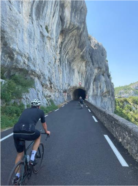
Gorges de la Nesque