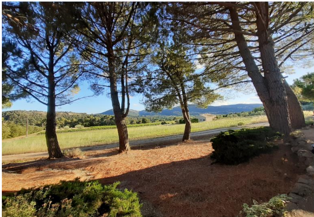
Uitzicht vanaf het terras bij Auberge d' Anais