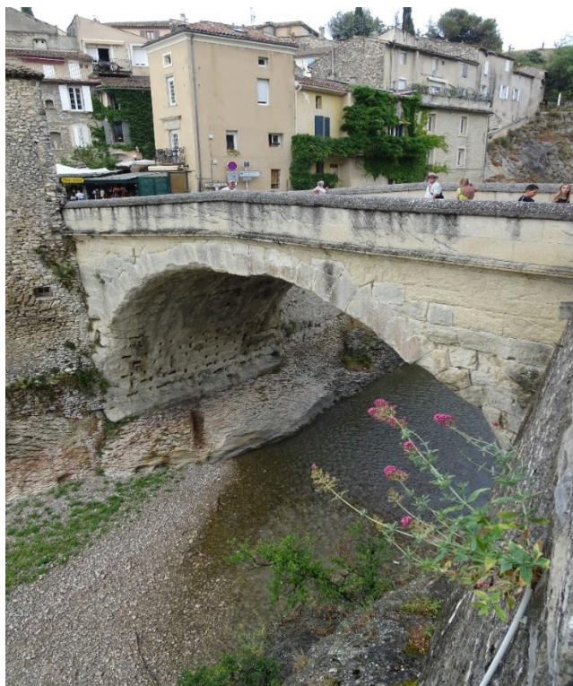
Romeinse brug in Vaison 2000 jaar oud!