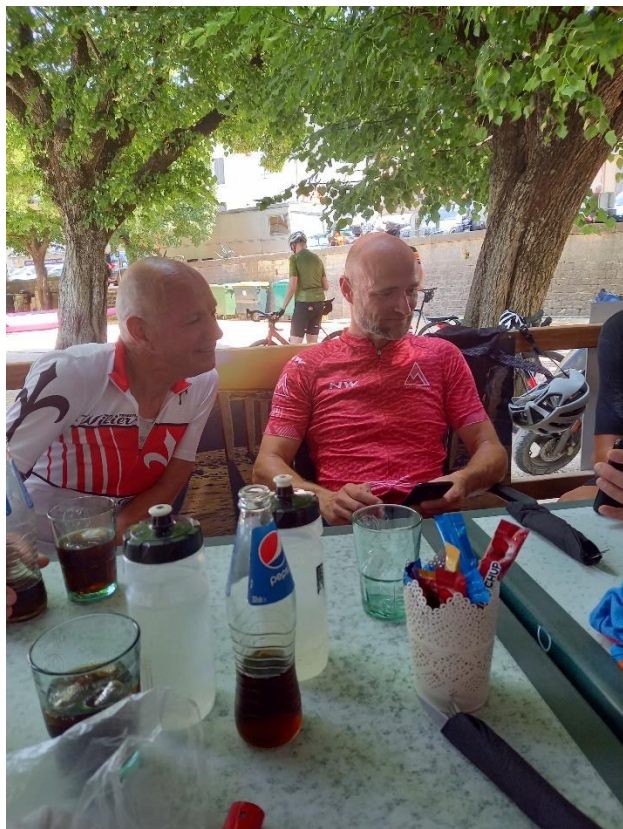
terras in Sault