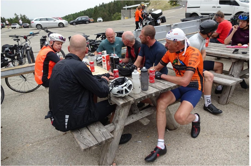
Terras Chalet Reynard

Na wat gedronken en gegeten te hebben volgt de afdaling richting Sault, een heerlijke meetrap afdaling, waar het zuur een beetje uit de benen getrapt kon worden. In Sault houden we de "traditionele" stop bij bar "La Promenade". Daarna gaat de route richting de Gorges de la Nesque, maar nu in de andere richting. Op dag 1 hebben ook door deze prachtige kloof gereden, alleen toen langs de andere kant. Nu een korte beklimming en een lange afdaling van \pm 18 km over prachtig asfalt. Heerlijk om naar beneden te rijden en dat gebeurt dan ook kop over kop met een paar man. Beneden weer verzamelt en de route wordt vervolgd met nog een vervelend stuk vals plat naar Flassan. Daarna afdalen naar Bedoin waar we nog even wat drinken om de laatste 25 km te rijden. Vanuit Bedoin volgt dan eerst de Col de la Madeleine van de andere zijde. Daar eenmaal boven is het hoofdzakelijk naar beneden tot aan het hotel. In de laatste 100m rijdt Jan nog lek op het onverharde stukje naar het hotel. Later bleek dit de enige lekke band van de gehele week.