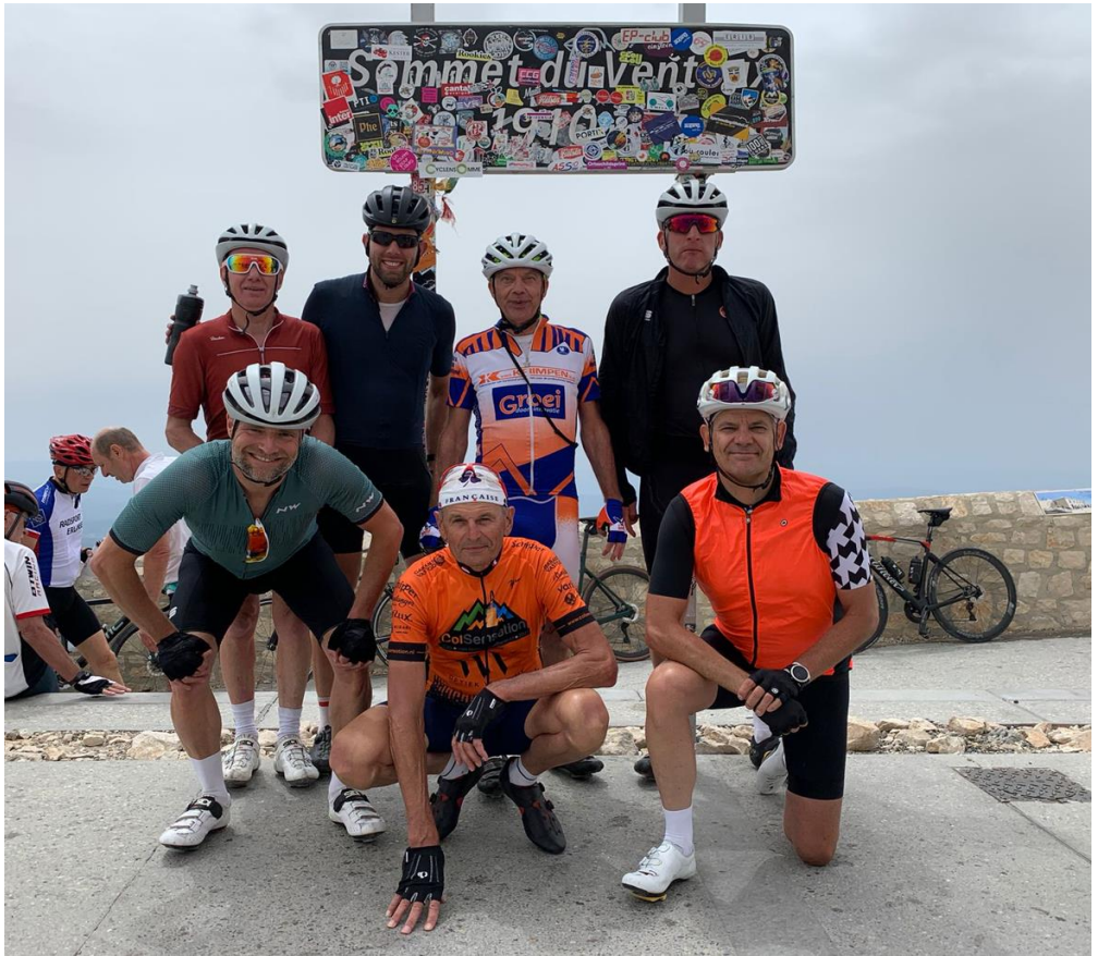
Op de top van de Ventoux

Hierna volgde de afdaling terug naar Chalet Reynard, om daar wat te drinken en de bidons terug op te vullen want de route voor deze dag had nog \pm 90 km op de planning staan.