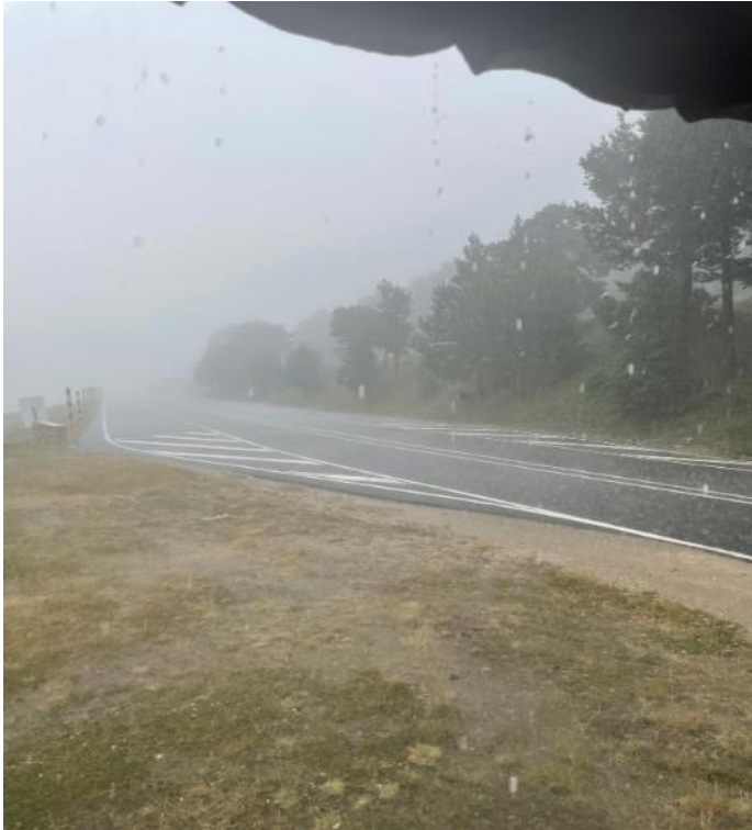
stortbui met hagel

Nico was al een stuk verder in de afdaling, Toine en ik reden in de stromende regen voorzichtig naar beneden, doorweekt en blauw van de kou en niet wetend waar de andere waren. We zagen de modder op verschillende plaatsen over de weg stromen vooral onderaan bij Le Groseau. Aangekomen in Malaucène werd het gelukkig al weer droog. Hier stopten we en wilden nog wachten of er nog iemand kwam, maar de lucht werd weer donker en we besloten om door te rijden. Vlak bij Entrechaux begon het onweer opnieuw met wederom hagelstenen, nu konden we wel schuilen. We zagen een woonhuis waar we onder een afdak hebben gestaan tot het bijna droog was.