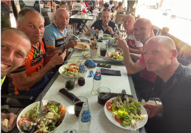
terras in Sault