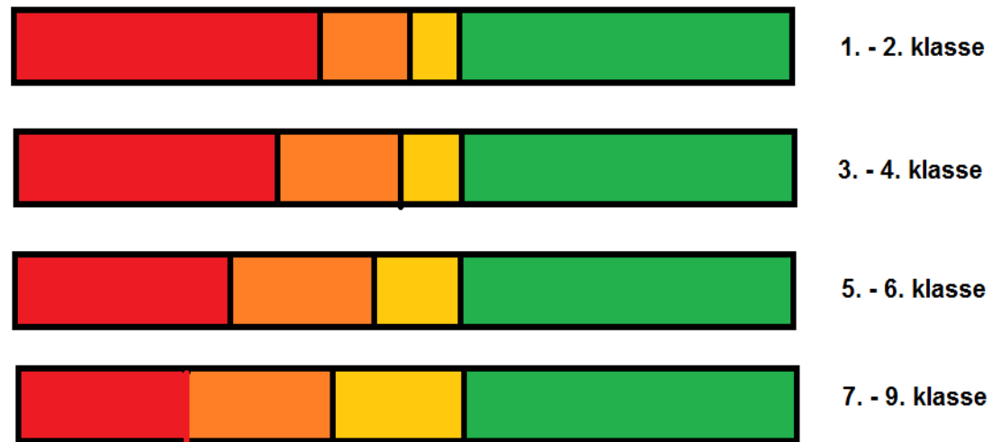
Kompetenceområdenes omfang på forskellige klassetrin i folkeskolen.