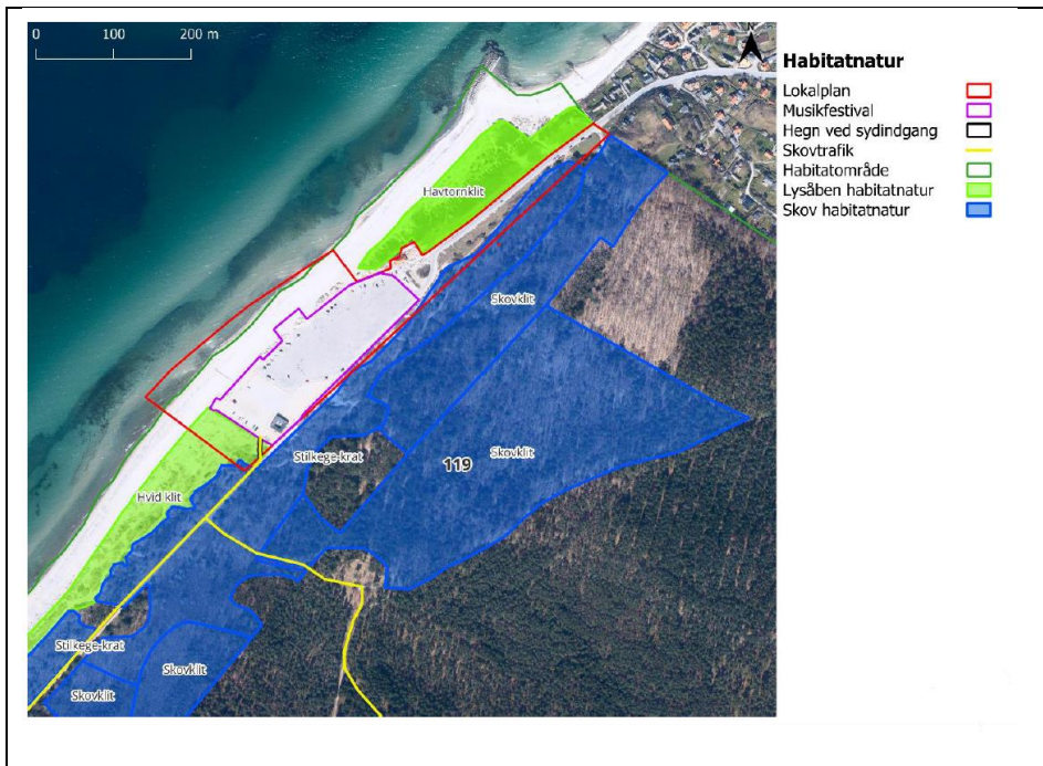
Billede 3: Oversigtskort over lokalplanområde med omkringliggende habitatnatur.