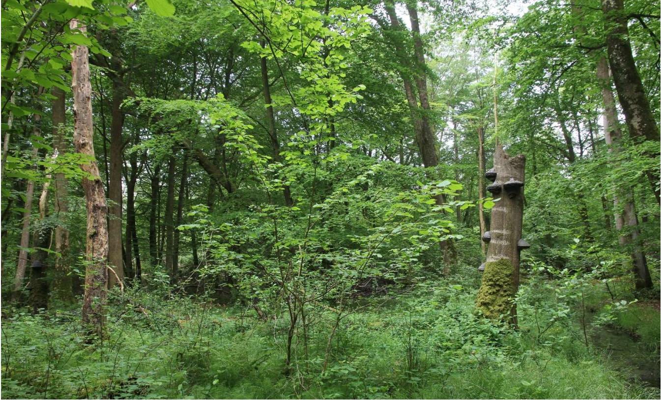
Stemmingsbillede fra Draved skov.