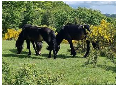
Heste på Molslab.

Har du endnu ikke set nærvilde heste leve deres eget liv, kan vi ikke anbefale det nok! Sæt dig gerne og betragt deres sociale interaktioner, måden de bruger landskabet og den naturlighed de indgår i det danske landskab med – det er balsam for sjælen og en øjenåbner for det vilde liv vi kan få meget mere af i Danmark.