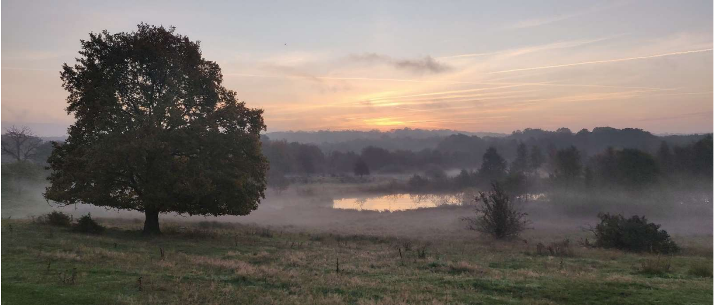
Stemmingsbillede fra Vaserne ved Birkerød.