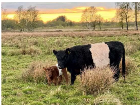
Gallowayko med kalv. Flere af de nævnte steder har de både nærvilde heste og kvæg.

Hvis du vil se nærvilde heste med blank pels og bølgende maner, er der efterhånden temmelig mange steder at besøge i hele landet. Er du i Jylland anbefaler vi Hammer Bakker i Vendsyssel, Skindbjerglund ved Skørping, Molslaboratoriet på Djursland eller Bindeballe ved Vejle. På Fyn og øerne kan man ikke komme uden om Sydlangelands spids, Bøtøskoven i Guldborgsund, eller Kohaveskoven ved Odense. Omkring Sjælland er det oplagt at tage forbi Knudshoved Odde ved Vordingborg, Røsnæs ved