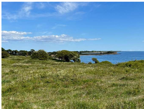
Vildt landskab.

Naturstyrelsen inviterer alle landet nnp-bestyrelser til heldagskonference om det kommende arbejde i bestyrelserne. Der er rigtig mange aspekter i etableringen af de nye nnp, og selvom bestyrelserne alene kan indstille – og altså ikke bestemme – hvordan forvaltningen skal ske i den enkelte nnp, er det vigtigt at de er klædt fagligt på til opgaven og kan træffe beslutninger på oplyst grundlag. På konferencen vil hvert medlem kunne deltage i fire workshops på nedenstående liste, og fra DVNs side glæder vi os over at se hvor meget det naturmæssige fylder – det skulle give håb for at opkvalificere bestyrelsernes naturmæssige kompetencer. De fleste nnp-bestyrelser mødes for første