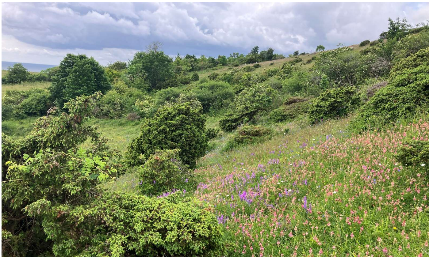
Høvblege på Møn, juniblomstringen er smuk!