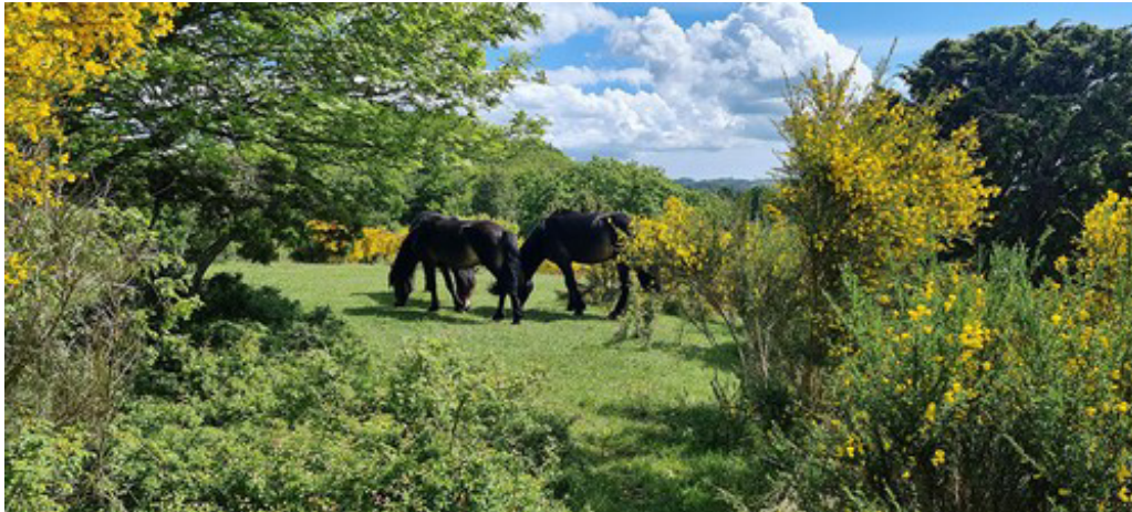
Vilde heste på Molslaboratoriet. Morten DD Hansen