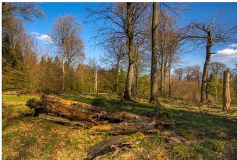
Urørt Skov, Knagerne Vesterskov