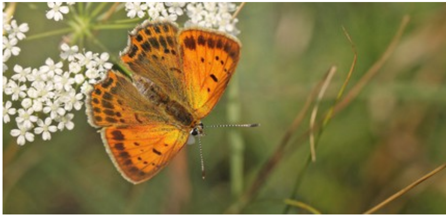
Dukatsommerfugl.