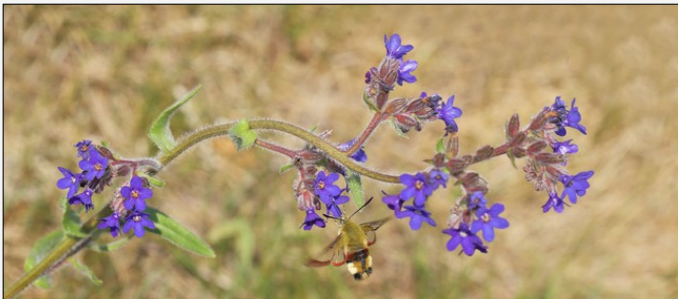
Bredrandet humlebisværmer