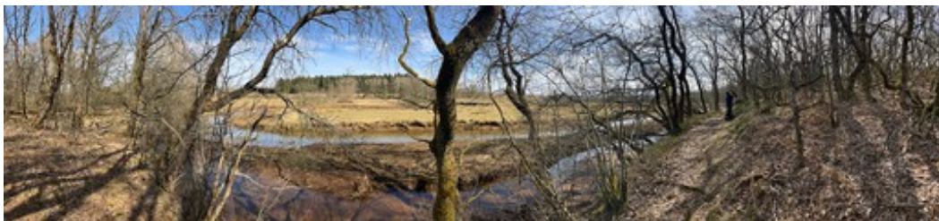
Stråsø

Tøv ikke med at kontakte den afdeling der er dig nærmest, hvis du har lyst til at bidrage til lokalafdelingens arbejde.