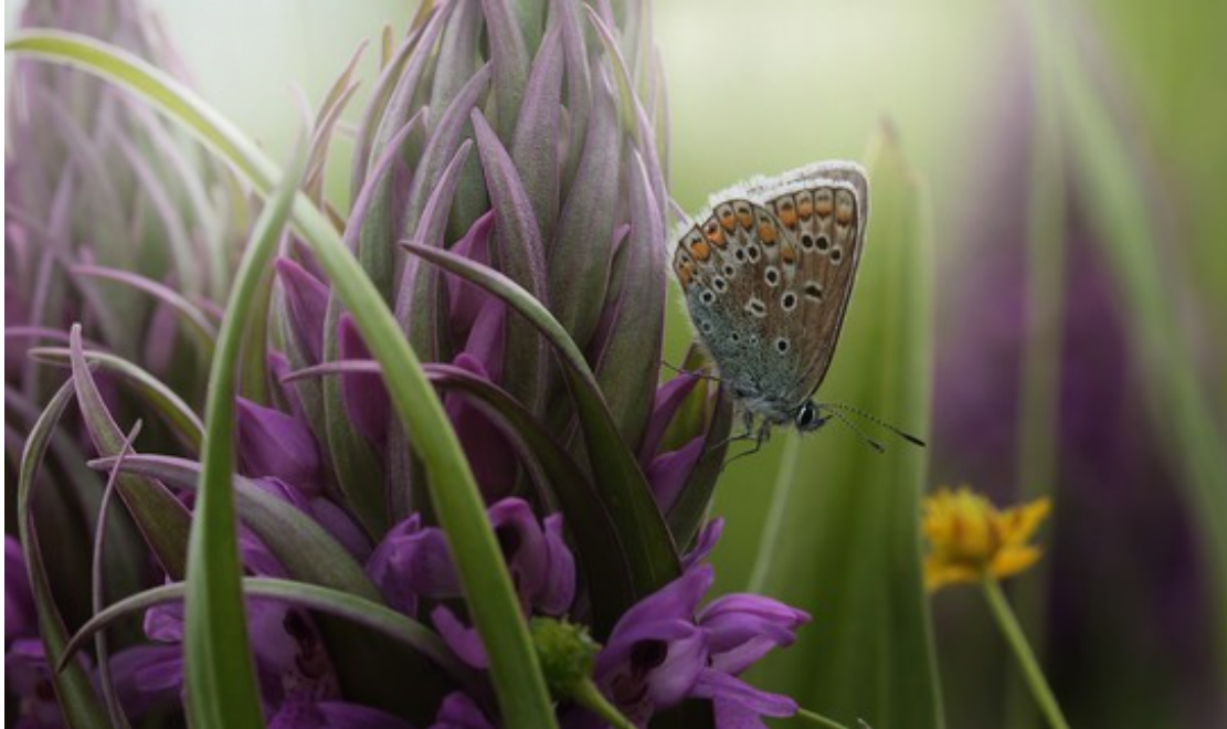
Alm. blåfugl på priklæbet gøgeurt.