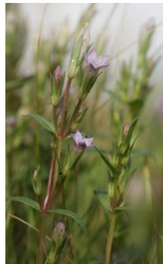
Engensian