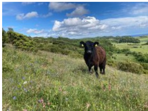
Høvblege

Der er en positiv udvikling i gang hvor naturen får lov at fylde meget mere på toppolitisk plan end nogensinde før. Vi skal sørge for at denne udvikling fortsætter, og derfor vil vi sætte gang i en række initiativer så DVNs lokalafdelinger kan få deres lokale folketingskandidater i tale. Vi er sammen med en række grønne organisationer ved at planlægge en kampagne om at gøre kravet om en Biodiversitetslov til et valgtema. Herunder lave grønne valgmøder, grønne naturvandring med politikere og interesserede vælgere. Måske vil vi anbefale at fokusere på bestemte valgkredse og bestemte politikere, men det er endnu i støbeskeen. I vil høre nærmere inden længe.