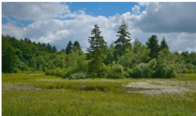
Bidstrup (Anstrop) Skov - en del af Bidstrup Skovene

Tag med på vandring i Bidstrup! Danmarks Vilde Naturs lokalafdeling for Midtsjælland holder vandring for medlemmer med familie: