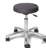
Round Lux Alu