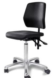
Work Classic alu