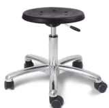
Round Classic Alu

Die Stuhl-Teile müssen bei Raumtemperatur zusammengebaut werden. Bei beschädigten Stuhl-Teilen darf der Stuhl nicht montiert werden. Reinigung des Stuhls mit einem feuchten Tuch (keine Reinigungsmittel). Bitte befolgen Sie die Anweisungen zum Wechseln des Zylinders und zur Verwendung des Stuhls.