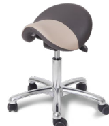
Saddle Lux Vip Alu