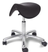
Saddle Classic Vip Alu