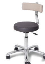
Round Lux Alu with bag