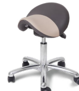
Saddle Lux Move Alu