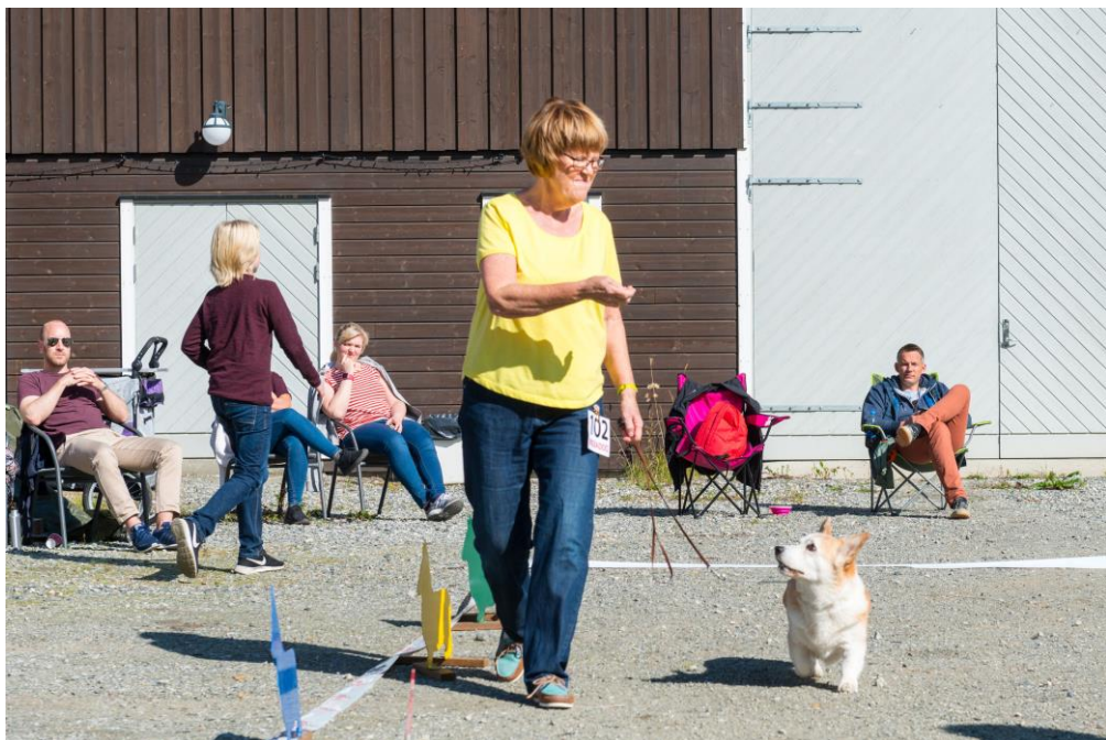
Dagens eldste corgi: Andy Cap 15 år