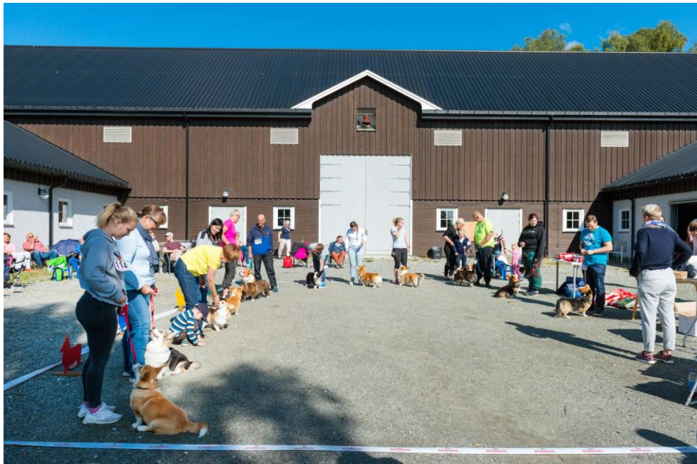
Ringen var full da vakreste pels og øyne skulle kåres