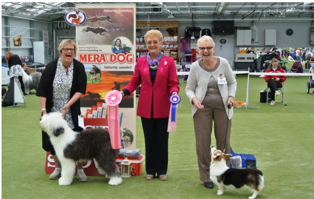
BIS Valp 1 og 2