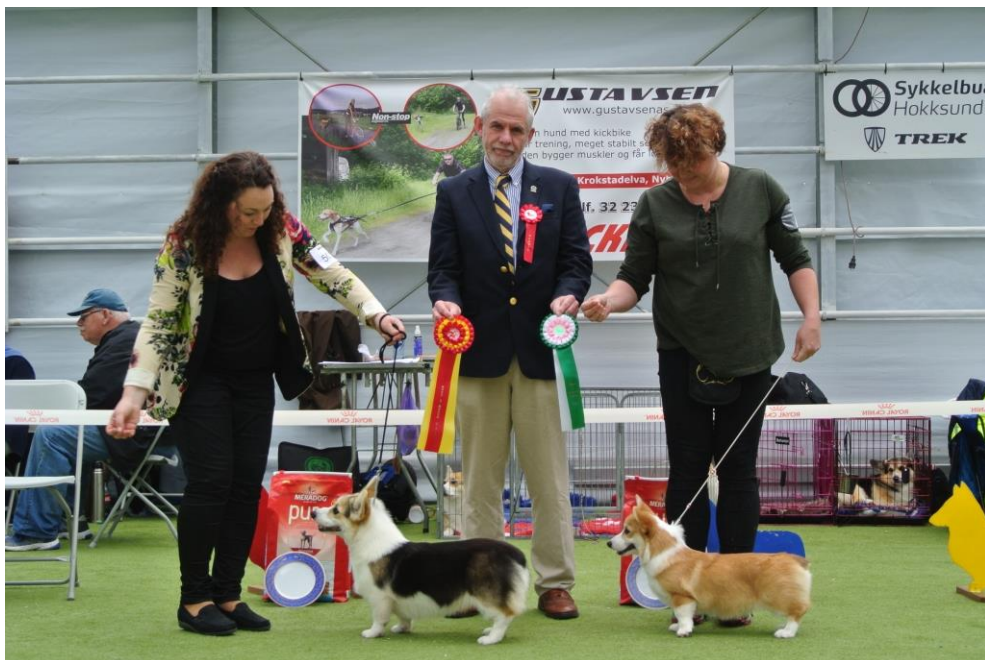
BIR og BIM Valp

Vinner er katalog nr: 0084 Montmorenja's Naughty But Nice