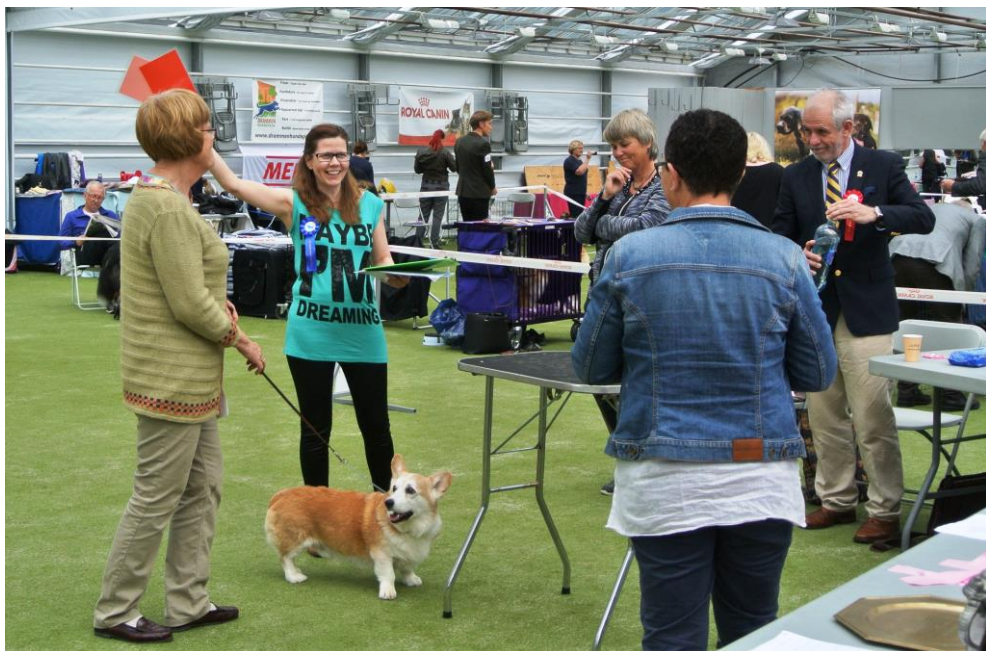
CK til 14-åringen