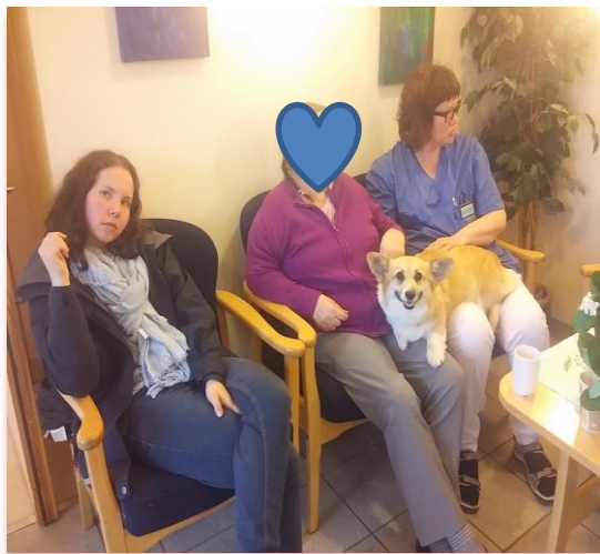
Det blir mye kos med en hund på fanget.