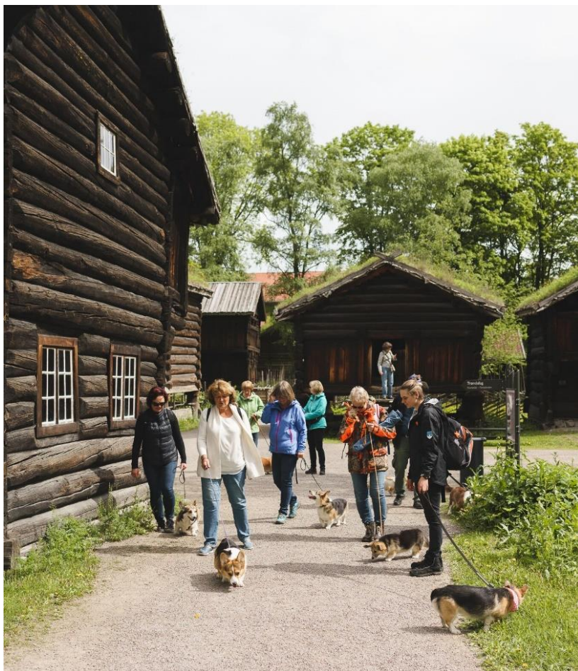
Vi vandrer i naturskjønne omgivelser

Norsk Welsh Corgi klubb markerte hundens dag på Folkemuseet på Bygdøy med turgåing og medbragt lunsj.