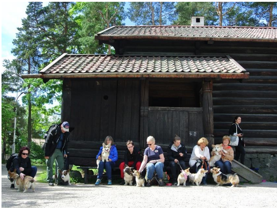
Bildet viser noen av deltakerne under lunsjen

Takk til alle som var med på å gjøre vår versjon av Hundens dag så vellykket!