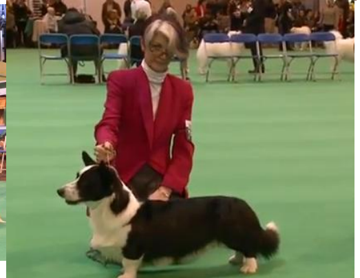
BIR Pembroke (til v.) og BIR Cardigan