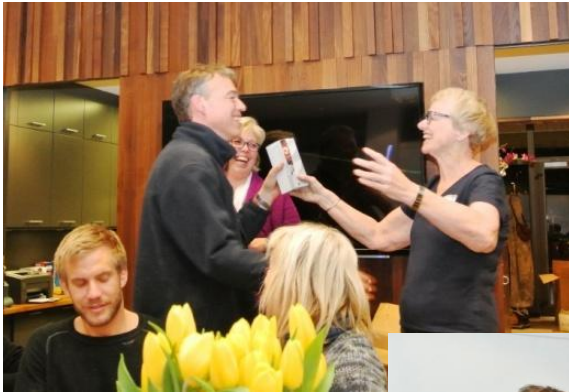
Deretter vanket det heder og ære, vandrepokaler og priser for fjorårets plasseringer