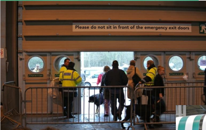
Streng kontroll ved lufteutgangene!