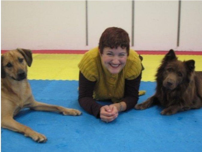
Fantastiske, unormale hunder.

Copyright Casey Lomonaco, Rewarding Behaviors Dog Training, www.rewardingbehaviors.com , Originally written for dogster (www.dogster.com). Oversatt av Rita Angler