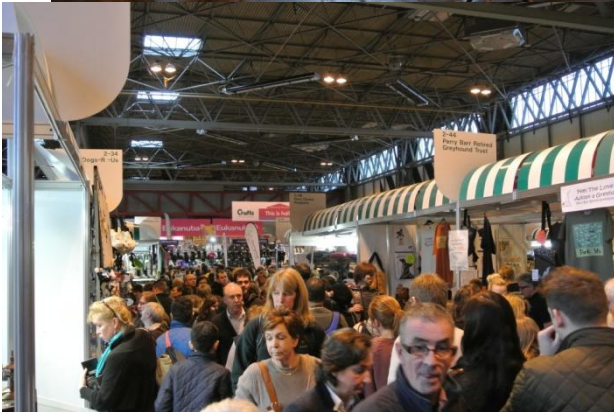
Trengsel i salgshallene