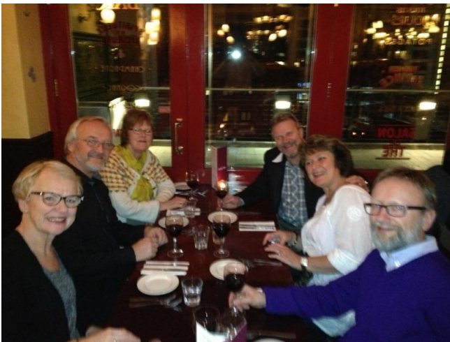
Reisefølget på en god fransk restaurant