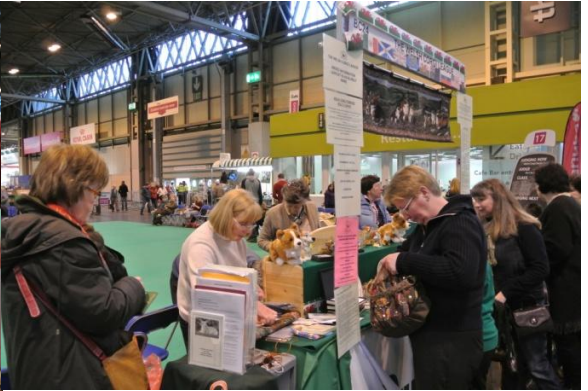
Corgishop, her gjaldt det å være tidlig ute!