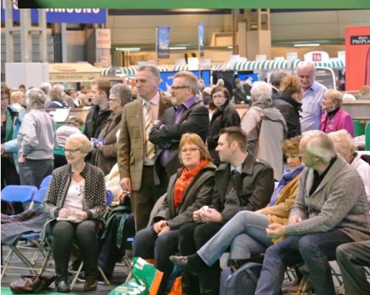
Norske corgivenner ringside