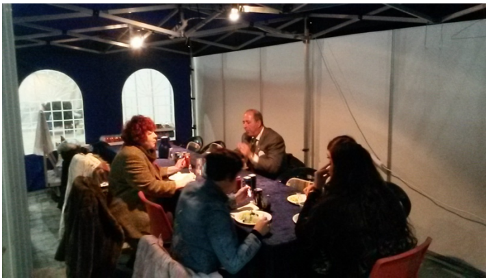
Ringpersonalet fikk god mat