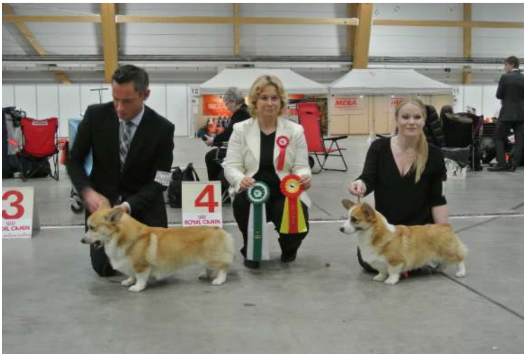
BIR og BIM Pembroke