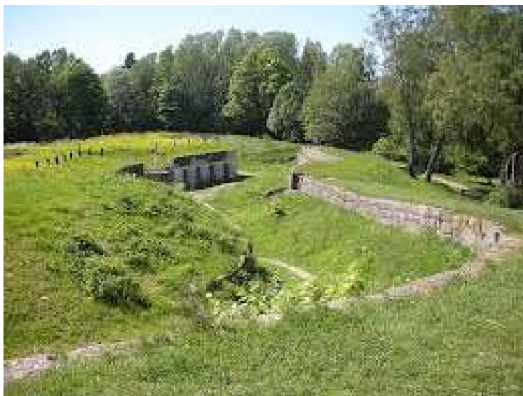
Fra forsvarsverkene ved Seiersten, Drøbak

PS 2014. Hvorfor skrive om et gammelt Drøbakhundeløp i Corgipost? Jeg kunne svare at det er fordi redaktøren bor i Drøbak. Men det er ikke helt derfor. Jeg synes i stedet det er morsomt at omtalte ungdom fra Langhus i dag er medlem av Corgiklubben. Det viser kanskje at tiden går. DS