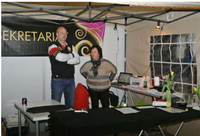
Rolig i sekretariatet akkurat her