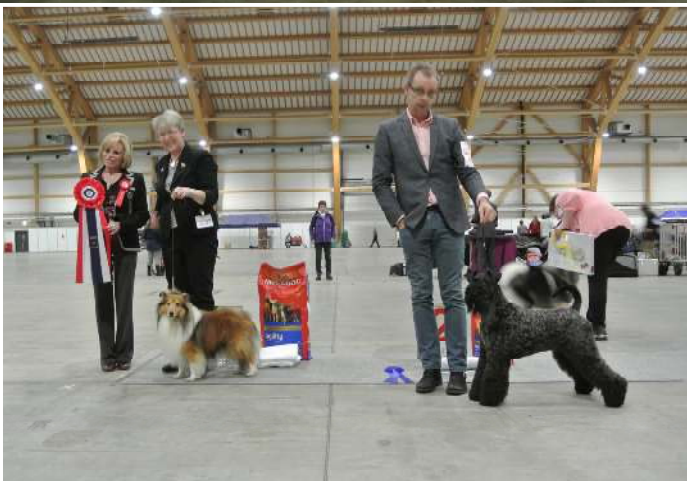
BIS-1 og 2

Fullstendig resultatliste: Etter utst.resultater, side 52