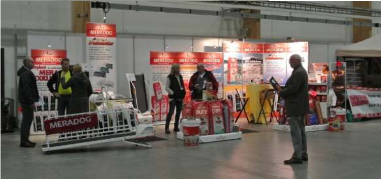
Vår hovedsponsor MERADOG var på plass og var generøs med premier til Corgi-vinnere