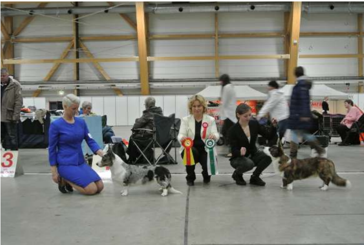
BIR og BIM Cardigan