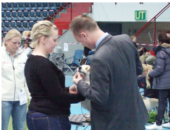
Dommeren tar en nærmere titt på Cross