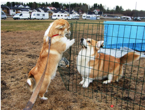
Det var ganske fullt i hallen, derfor var det greit å vente litt ute også