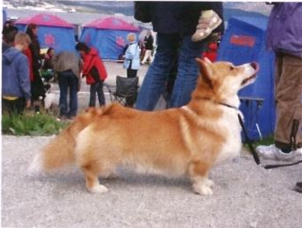
Benfro's Knight of Northern Lights. Eier: Hilde Wang