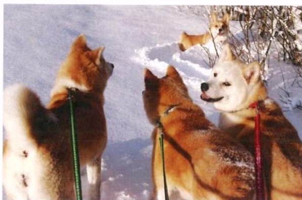
Rocky leder an i sporet