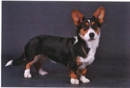
Imme's Buffy Ballerina, Eier: Janne Døving Drevik