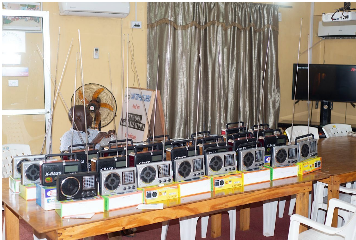
Camp for Peace Liberia

Salvaguardar los derechos y la participación de las mujeres en la consolidación de la paz también implica proteger a las mujeres constructoras de la paz. Las herramientas digitales pueden reducir las amenazas potenciales a la seguridad del personal femenino, que ya no necesita viajar largas distancias para unirse a un punto de encuentro, especialmente de noche, como lo mencionó un miembro de Camp for Peace Liberia .