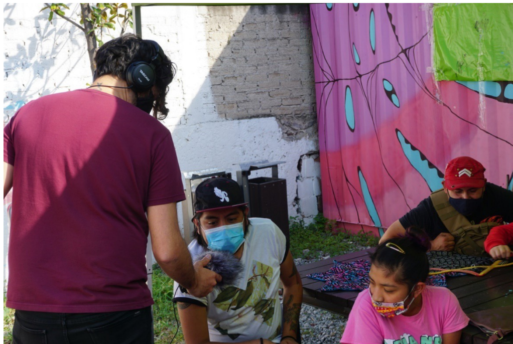
Sesión de grabación, MasterPeace México

Además, el uso de la tecnología fortaleció la capacidad de los constructores de paz locales para llevar a cabo su trabajo a través de capacitación en habilidades en línea, que luego se transmitió en cascada a otros miembros de sus organizaciones, utilizando la suscripción de Zoom y pagando el acceso a Internet de los participantes para unirse a las sesiones. En última instancia, las habilidades aumentarán la eficacia de la consolidación de la paz local y la respuesta a las crisis.