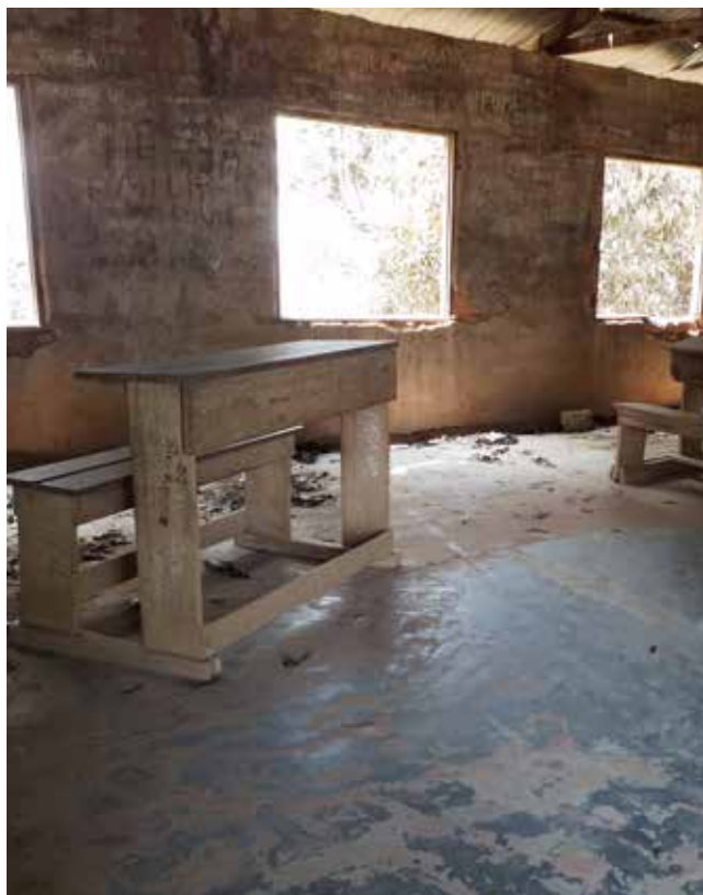
> Nood aan schoolbanken voor al onze scholen