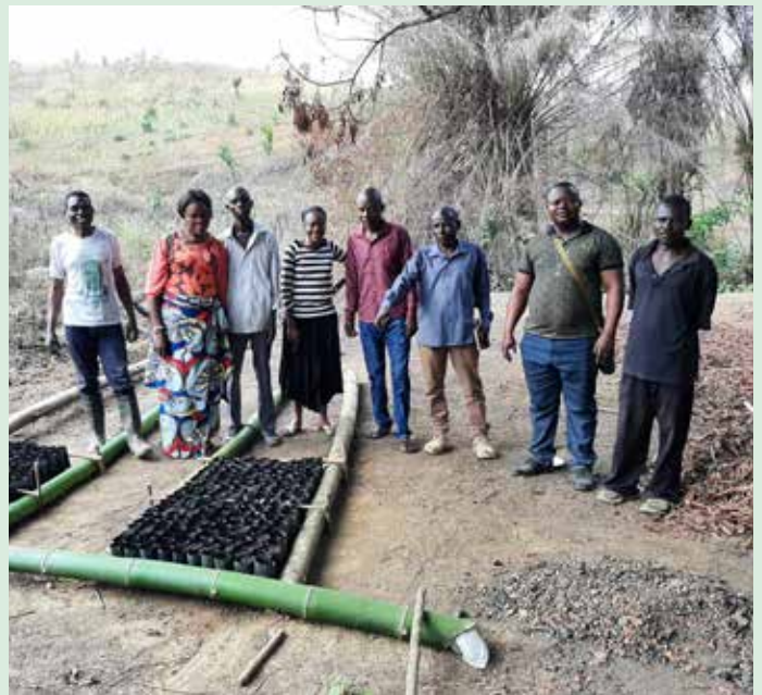
^ Opgeleide imkers