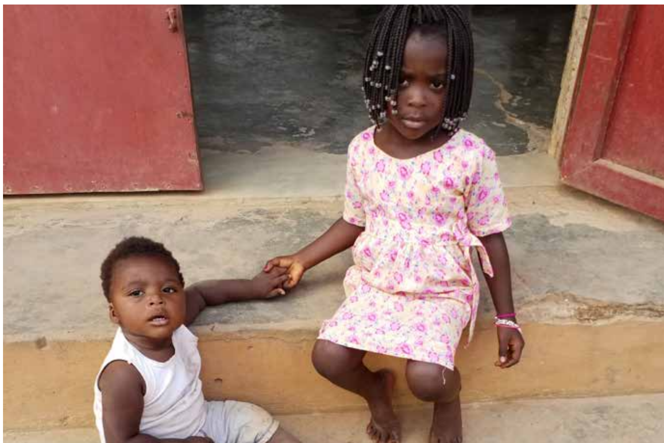
^ Naaatelier in Kimpese en Luozi

Onze opleiding geeft deze kindmoedertjes niet alleen hun waardigheid terug, verschillende cursisten kregen bovendien echte contracten in naaiateliers. Anderen beginnen een eigen “herstelpunt” in hun woning. Bij de start van het nieuwe jaar waren er overal weer 20 inschrijvingen en een wachtlijst.