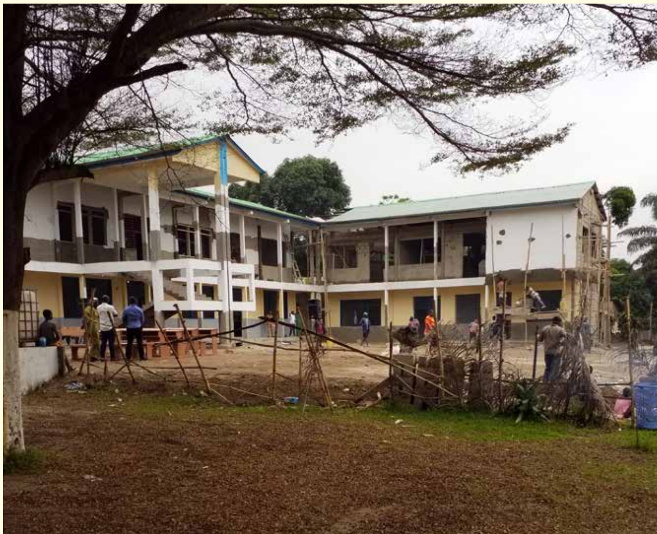
∨ Nieuwe school van Saint-Mugagga ^