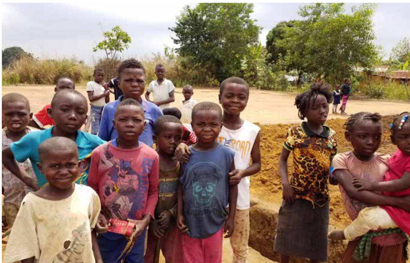
^ Plaats voor een nieuwe kapel voor Miabi