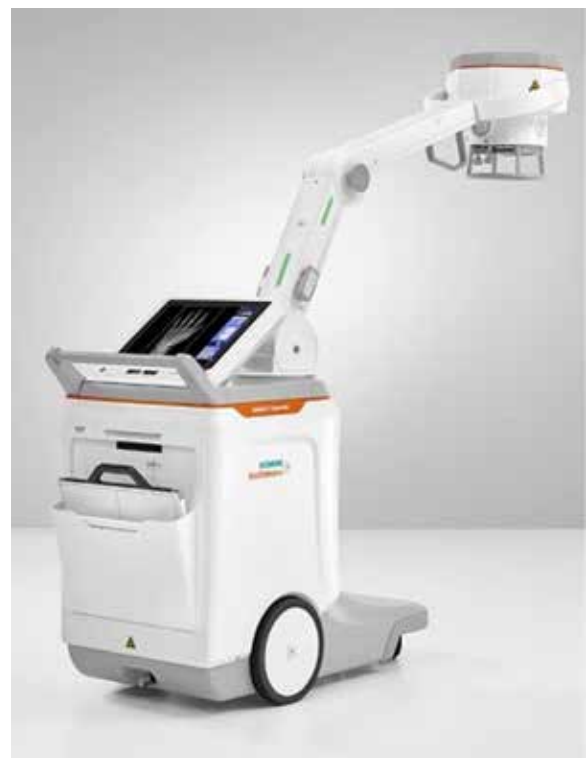
^ mobiel röntgentoestel

12 zonnepanelen en 6 batterijen zullen voortaan het ziekenhuis van extra stroom voorzien. Hierdoor moet de vervuilende “dieselgenerator” minder aangezet worden en zal de energiefactuur van 500 USD per maand substantieel dalen.