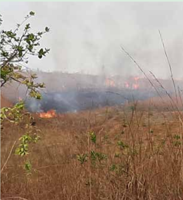
^ Vele hectaren afgebrand

Daarnaast hebben we echter nog een veel groter dossier om in 10 dorpen vele hectaren savanna-grond terug te herbebossen en zo de bijencultuur extra te bevorderen. Het doel is om nog in 5 extra dorpen reeds bijenkasten te plaatsen en te starten met herbebossing. Duizenden hectaren grond werden in het verleden en nog steeds afgebrand door arme mensen die op deze manier houtskool willen maken om naar Kinshasa te sturen. Er wordt overwegend nog op open vuren gekookt voor de woningen. Dat willekeurig afbranden willen deze dorpen een halt toeroepen. Zij merken ook nu reeds de klimaatsverandering en willen met het bijenproject hun steentje bijdragen aan het klimaat en de opwarming van de aarde. Door de massale herbebossing kan de CO 2 -uitstoot drastisch verminderd worden.