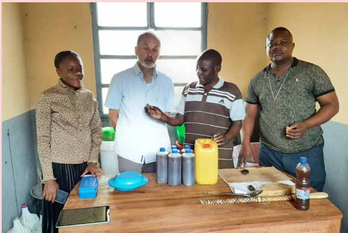
Opleiding tot imker