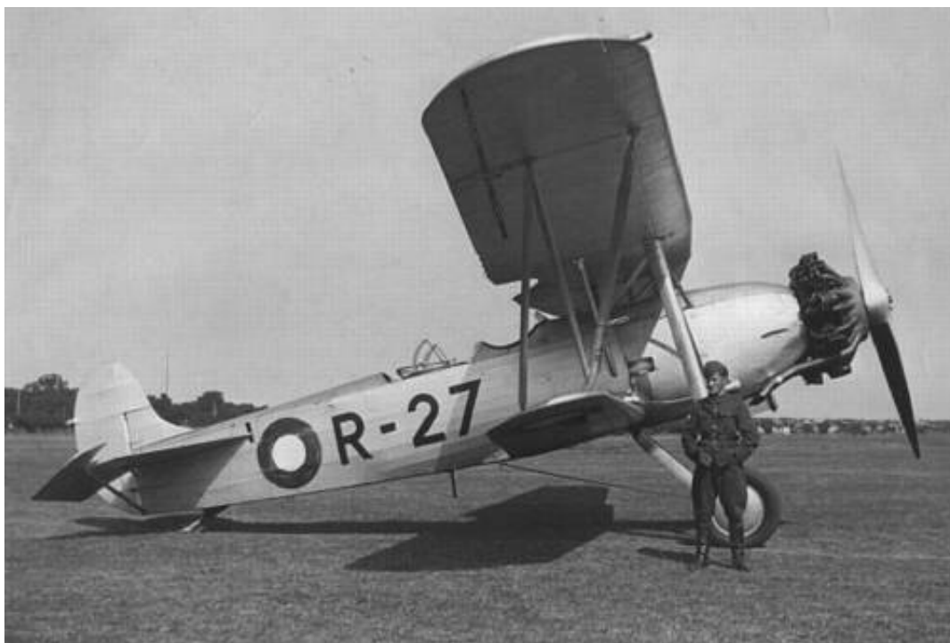
Fokker C VM/33 (II R).