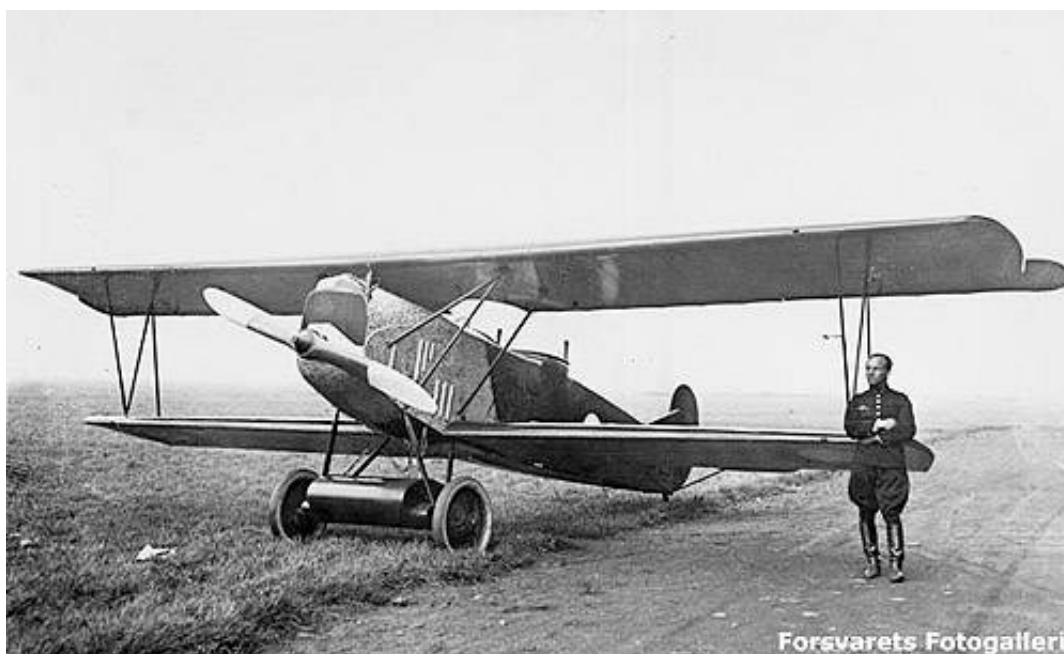
Fokker C I.

To Fokker-maskiner blev leveret henholdsvis 30. september og 13. oktober 1923, og tre af en lidt ældre type blev bygget af Flyverkorpssets Værksteder i 1925. De var oprindeligt nummereret 2-6 (1 anvendtes ikke), men blev i 1926 omnummereret O-51 - O-55. Den sidste C I blev taget ud af tjeneste i 1933.