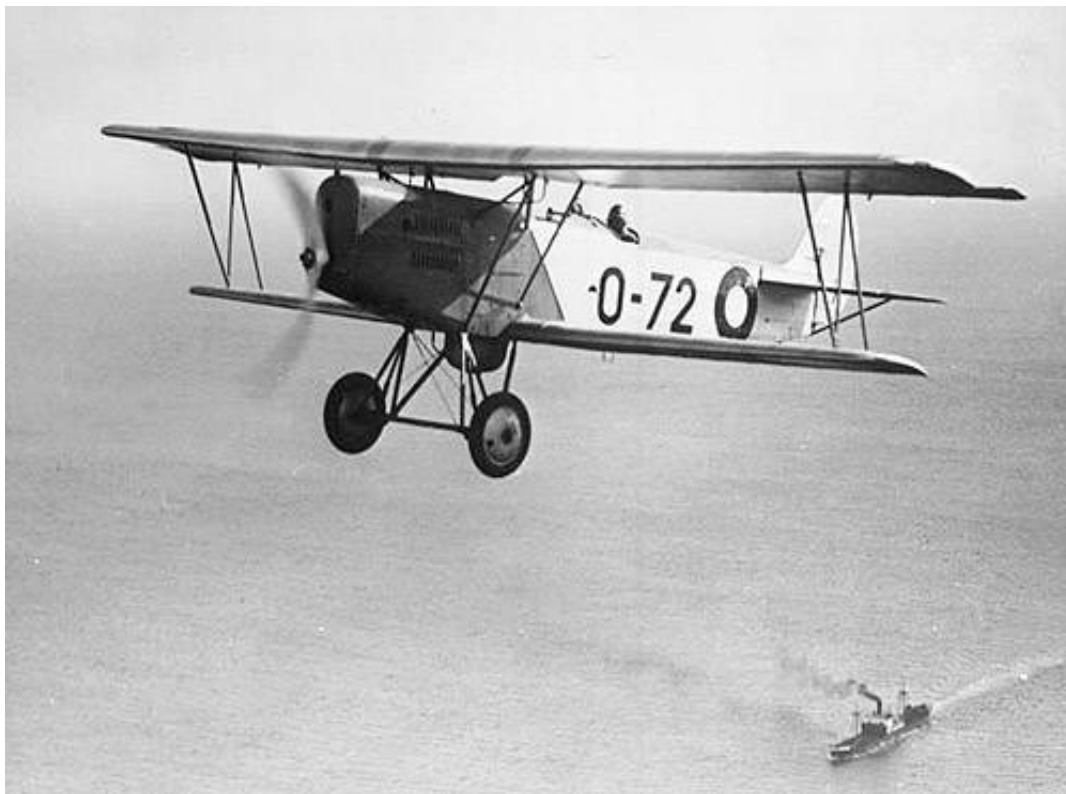
O-maskine (II O). Fra Flyvevåbnets historiske Samling.

O-maskinen er omtalt i Udklipsark: Danske Fly, cirka 1935, Del 1. Billedet viser dog maskinen i den ensædede udgave II O , mens tegningen på udklipsarket tydeligt viser såvel pilot som observatør.