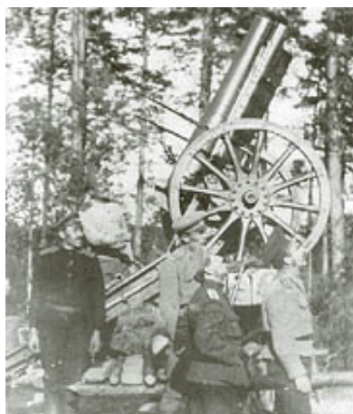
Russisk 122 mm haubits Model 1910 indsat som luftværn, 1917.