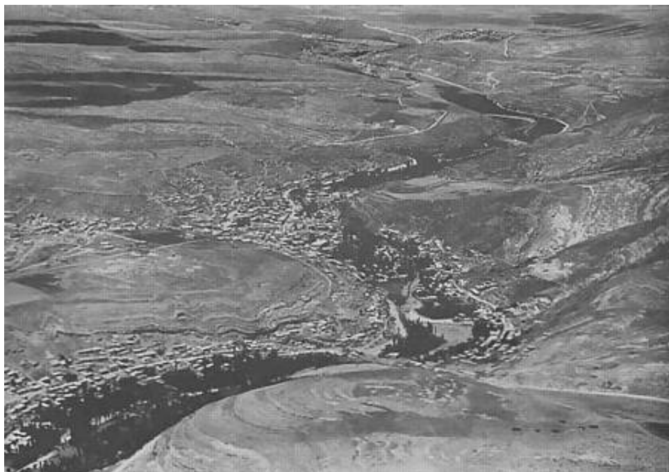
Amman, set fra sydvest 14 ).

Som den største by i området, er det ikke svært at stedfæste Amman, der her ses på et luftfotografi, optaget af Royal Air Force i 1929.