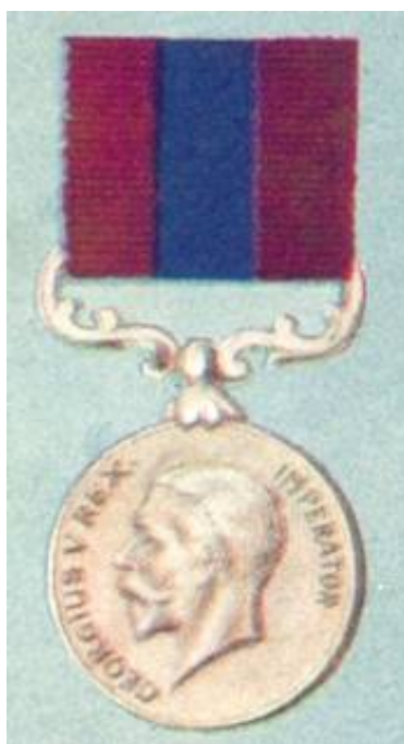
Distinguished Conduct Medal 18 ).

Ekspeditionskorpsets chef, General Allenby, var ikke mindre tilfreds, idet han skrev følgende til bl.a. generalguvernøren på Jamaica: "I have great pleasure in informing you of the excellent conduct of the machine-gun section of the BWIR during two successful raids on the Turkish trenches. All ranks behaved with great gallantry under heavy rifle fire, and contributed in no small measure to the success of the operation."