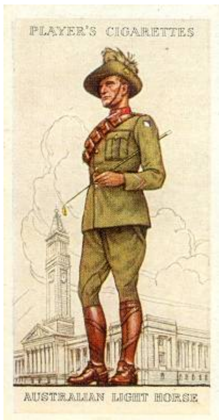
Australian Light Horse

This badge was first worn by the original N.Z. Expeditionary Force on their well-known "slouch" hats. It illustrates a fern leaf - the emblematic leaf of New Zealand - and the same design on a smaller scale is worn by the N.Z. Staff Officers as a collar badge.