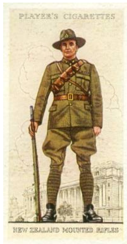
New Zealand Mounted Rifles