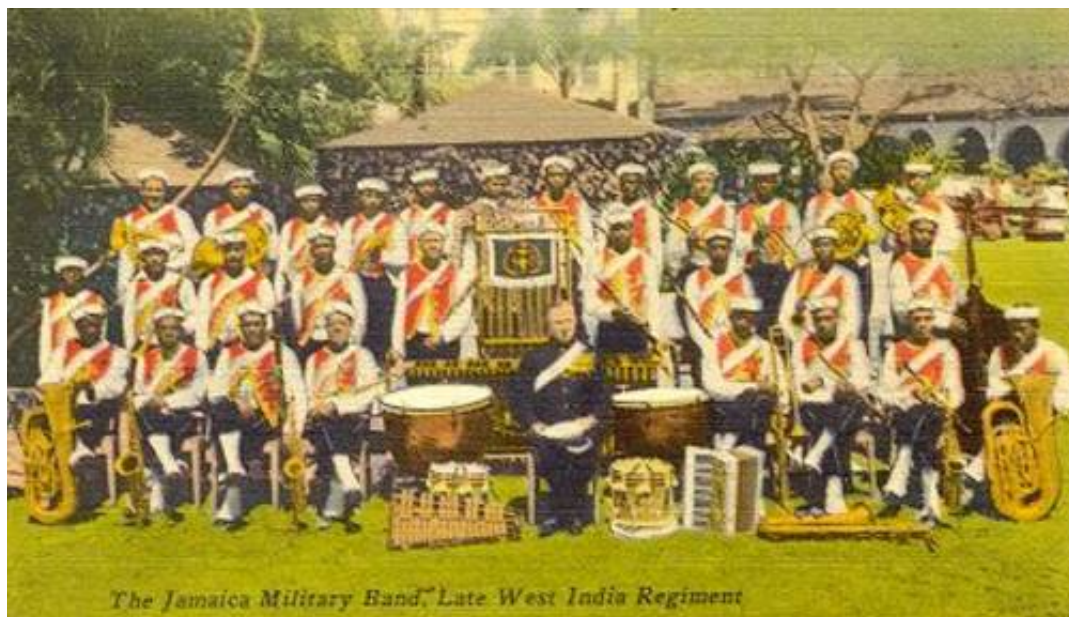
The Jamaica Military Band, late West India Regiment. Fra Vintage Brass Band Pictures (The Harrogate Band).

Infantry Volunteers, der var en lokalforsvarsenhed. Musikkorpset eksisterer stadig som en del af Jamaicas forsvar, og nutidens uniformer er stort set som de gamle.