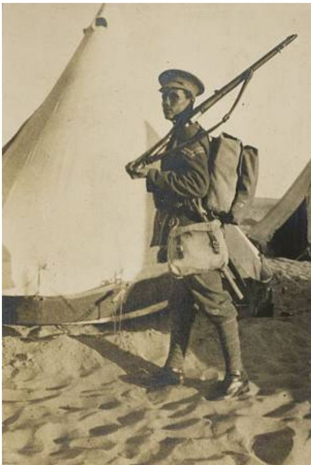
Korporal fra The British West Indies Regiment. Fra Kilde 2.