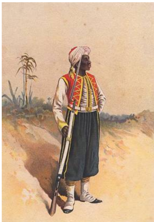
2 nd Bn. West India Regiment, ca. 1890, tegnet af G.D. Giles 20 .

1 st West India Regiment havde hvide opslag, mens 2 nd West India Regiment havde gule opslag 21 ).