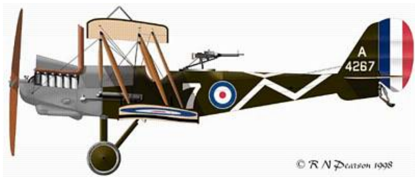
R.E. 8. Fra History in Illustration.