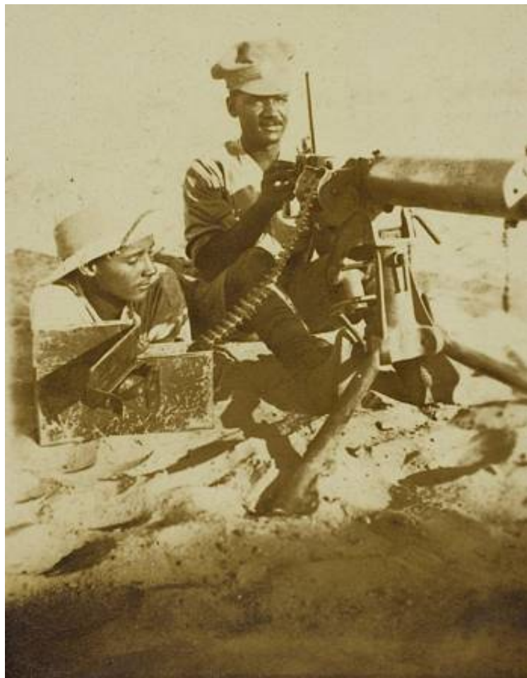
Maskingeværskytte og hjælper fra The British West Indies Regiment. Fra Kilde 2.