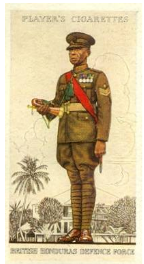
British Honduras Defence Force 13 .

Kort nr. 8, 11 og 49 i Player's cigaretkortserie Military Uniforms of the British Empire Overseas, 1938.