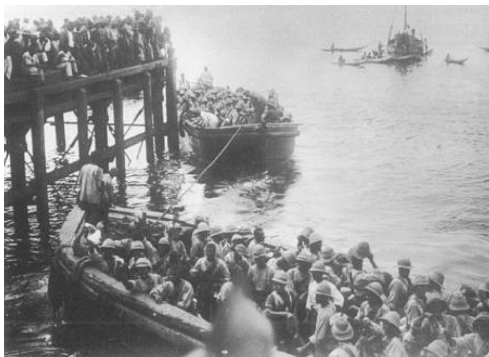
2 nd Bn. West India Regiment indskibes i Freetown (Sierra Leone) på vej mod Østafrika, 1916.

Er man det mindste interesseret i billeder af militære musikkorps, så er denne side absolut et besøg værd.