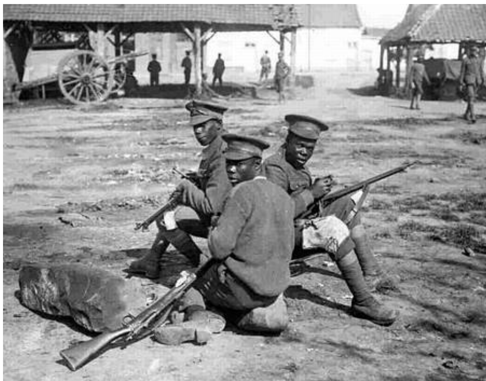
Soldater fra The British West Indies Regiment, fotograferet "Somewhere in France". Fra Kilde 10.

Mange fulgte opfordringen til at gøre deres pligt for Konge og Fædreland, og Kilde 8 indeholder følgende oversigt: