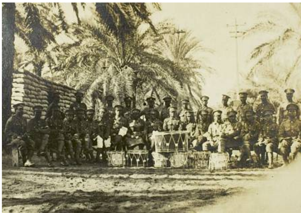
Tambourkorpsset fra 1 st Bn. The British West Indies Regiment, fotograferet i en palmelund ved Dueidar.