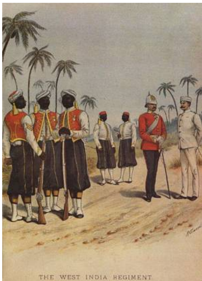
1 st Bn. West India Regiment, ca. 1890, tegnet af Richard Simkin 19 .

1858 blev West India Regiment således udrustet. Regimentet bevarede denne gallauniform frem til 1927, hvor det blev nedlagt.