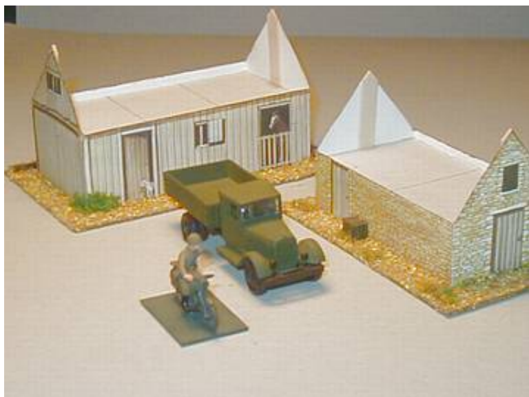
En russisk lastvogn, ledsaget af en motorordonnans, har gjort holdt i en "landsby".

Da husene skulle have et mere "naturligt" præg end dogmehusene, besluttede jeg, at fodstykkerne skulle behandles med savsmuld og nylongræs, så de bedre passer ind i krigsspilsterrænet.