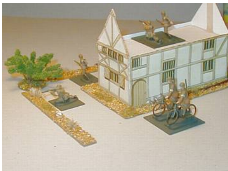
Ungarske cyklister i udkanten af en "by".

Lidt mørkebrunt savsmuld ( Heki ) og en smule "skumgummigræs" ( Heki ) fuldendte terrænmarkeringen, sammen med et par kviste, der gør det ud for træstammer.