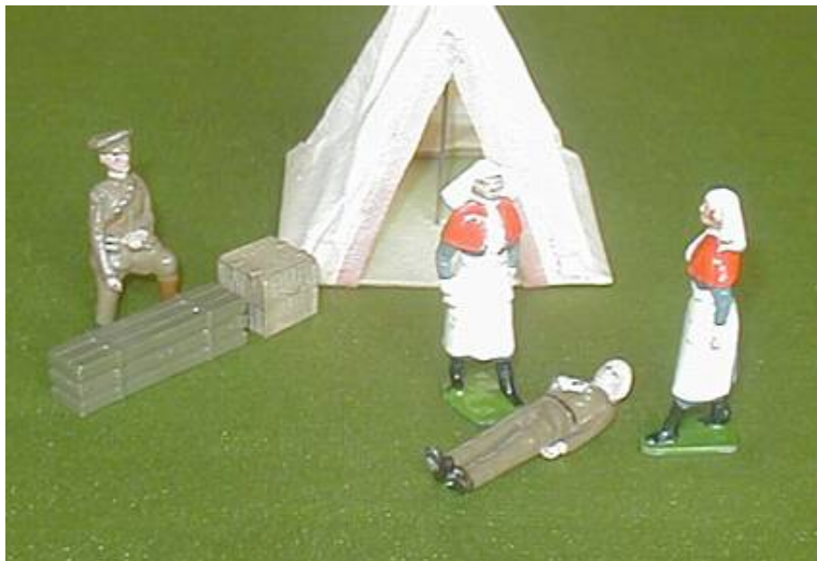
En Skytrex SMRA6 kasse i lang udgave og en Skytrex SMRA10 vidjekurv opstillet sammen med Britains figurer.