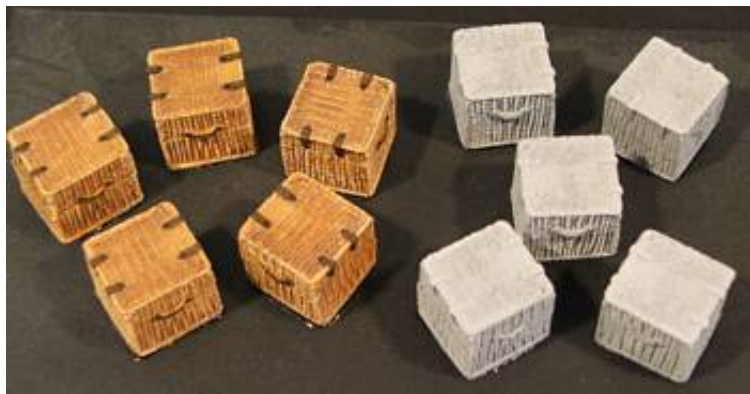
Large Baskets (Metal) SMRA10. Fra Skytrex .

Prisen for disse vidjekurve er også GBP 3.50. Der indgår 5 stk. i sættet. De måler 1,5 x 1,5 x 1,5 cm, og de er som kasserne også uden bund.