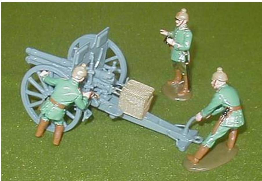
En Skytrex SMRA10 vidjekurv opstillet sammen med nyere Britains figurer.