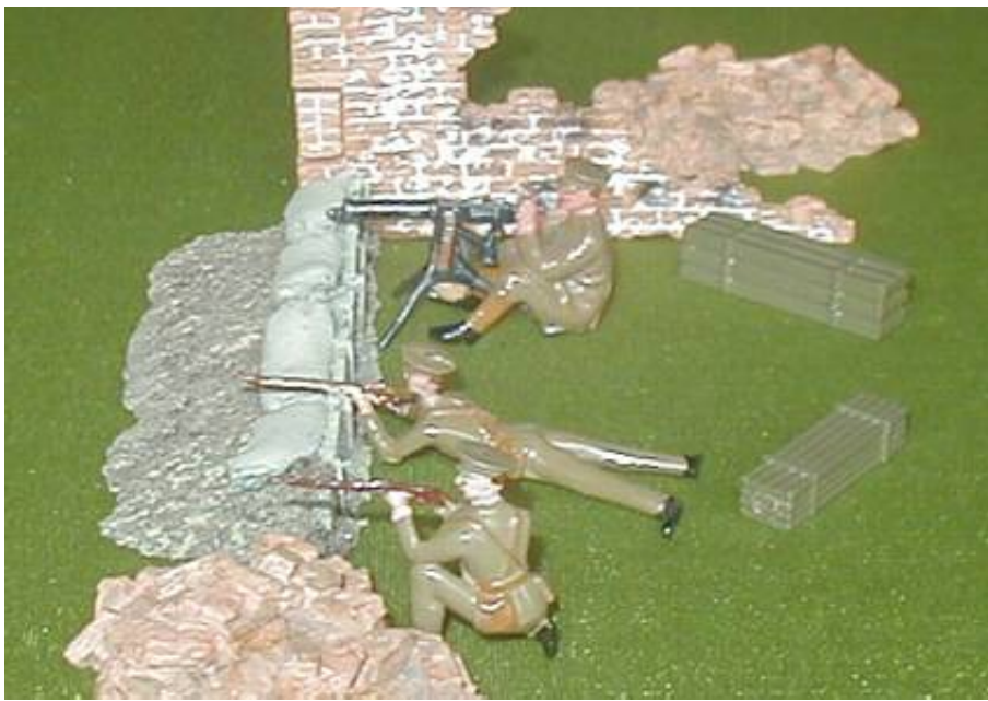
Skytrex SMRA6 kasser opstillet sammen med Britains figurer.