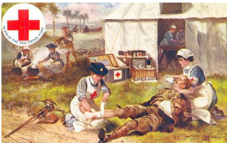
Sygeplejersker i arbejde, ca. 1914.