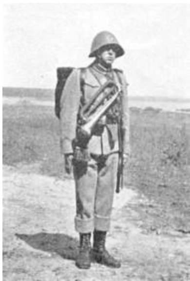
Føring af signalhorn.