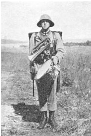
Udgangstilling for trommeslagning.