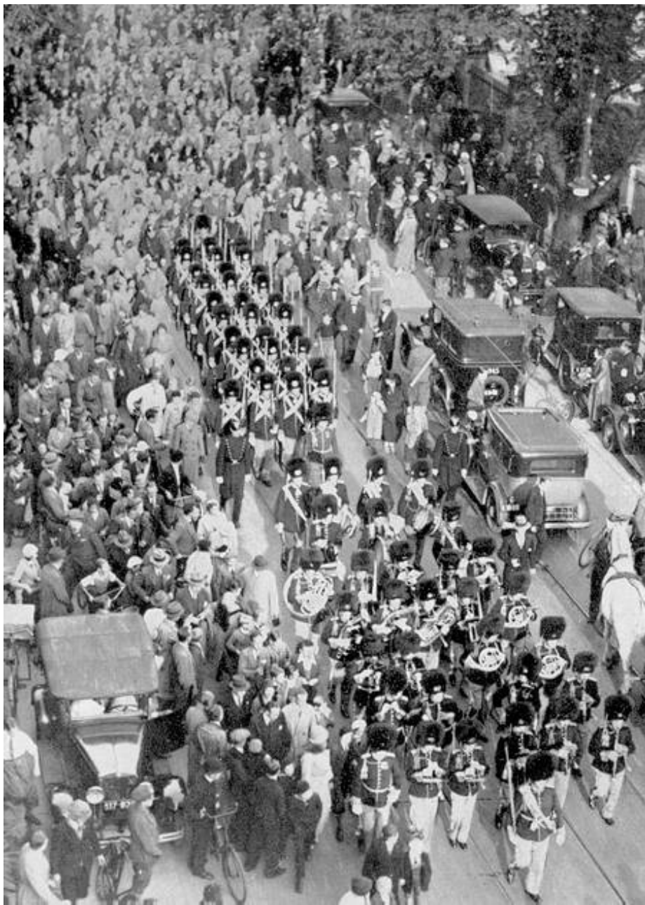
Vagtparaden på vej gennem København, ca. 1939. Fra Militærmusikken - Blade af dens historie, Minder om dens mænd af Niels Friis, Særtryk af Viborg Stiftstidende, Viborg 1941.