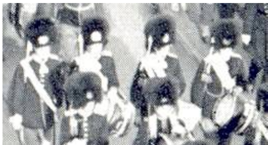
En fløjtespiller og tre trommeslagere.

Billedet kan også ses som et supplement til omtalen af Livgardens musikkorps i perioden 1922-1943, som findes i min artikel Om dansk militærmusik i 1911-1943.