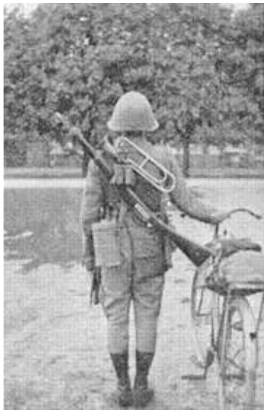
Føring af signaltrompet (2).

Kilde 3 omtaler føringen af signaltrompet for såvel ryttere som cyklister, og viser endda også billeder af sidstnævnte.