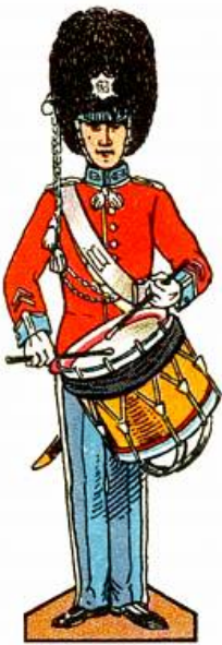
Reservehornblæser fra Livgarden, i rød galla, ca. 1941.

Omkring år 1900 genindføres trommen, men nu alene som musikinstrument, og der blev i Tyskland indkøbt nogle billige, flade bliktrummer, med tyskmalede reifer (= kanter).