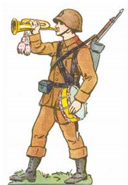
Reservehornblæser i feltuniform, ca. 1941.