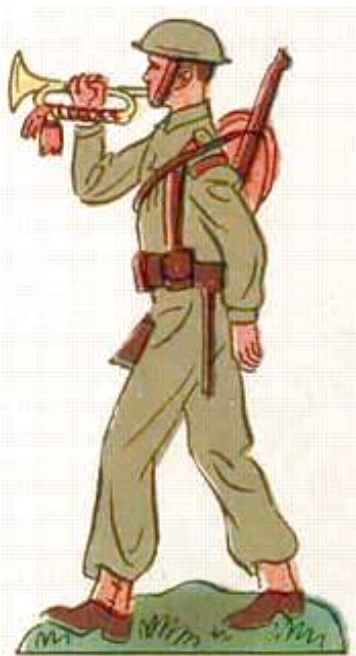
Reservehornblæser, ca. 1946.