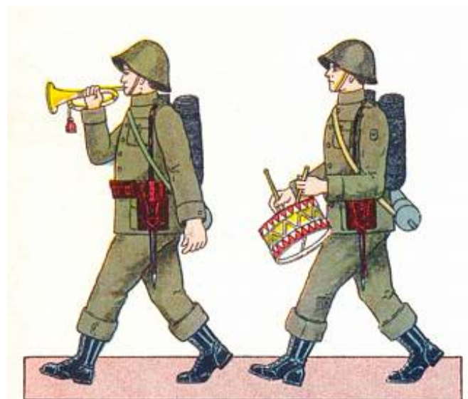
Reservehornblæsere, ca. 1937 4 ).

Kilde 3 anfører, at såfremt blæsningen udføres af flere, skal samtidighed i bevægelserne tilstræbes. Tilsvarende anføres, at signalerne blæses enstemmigt, hvis de blæses af flere og - for marchers vedkommende - ledsages af marchtromme.