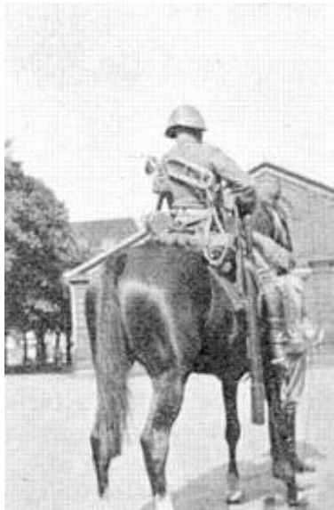
Føring af signaltrompet (1).