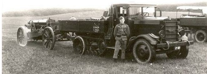
Triangel kanontraktor (2-151) med 15 cm felthaubits M.1929, Søndersborg, 1941. Billedet stammer fra den omtalte artikel.