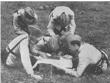
Kortlære. (Fra Kilde 3.)

I 1942 meldte 172, ud af cirka 330 polyteknikerstuderende, til denne ordning.