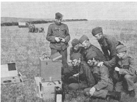
Radiolære. (Fra Kilde 3.)