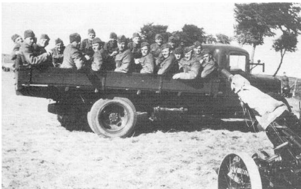
Skytseskadronen i Oksbøl.

20 mm maskinkanonen til højre i billedet er vist på de transporthjul, som blev anvendt, når kanonen ikke var monteret på f.eks. kanonsidevogn.