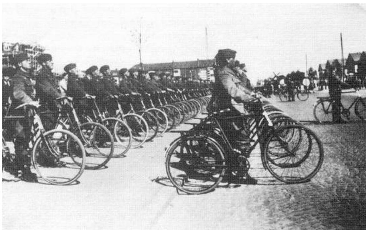
Parade i anledning af 90-årsdagen for Ryttertræfningen på Århus Mark den 31. maj 1849.