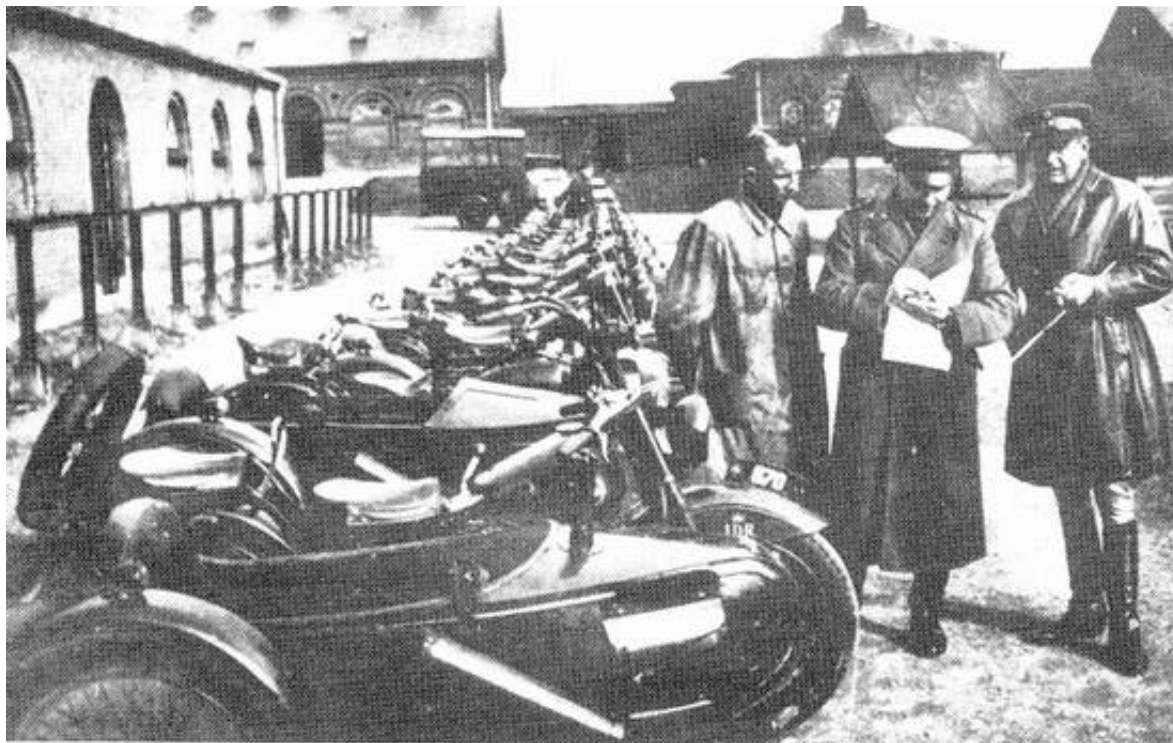
Motorcyklisteskadronen (3. Cyklisteskadron) i 1939.