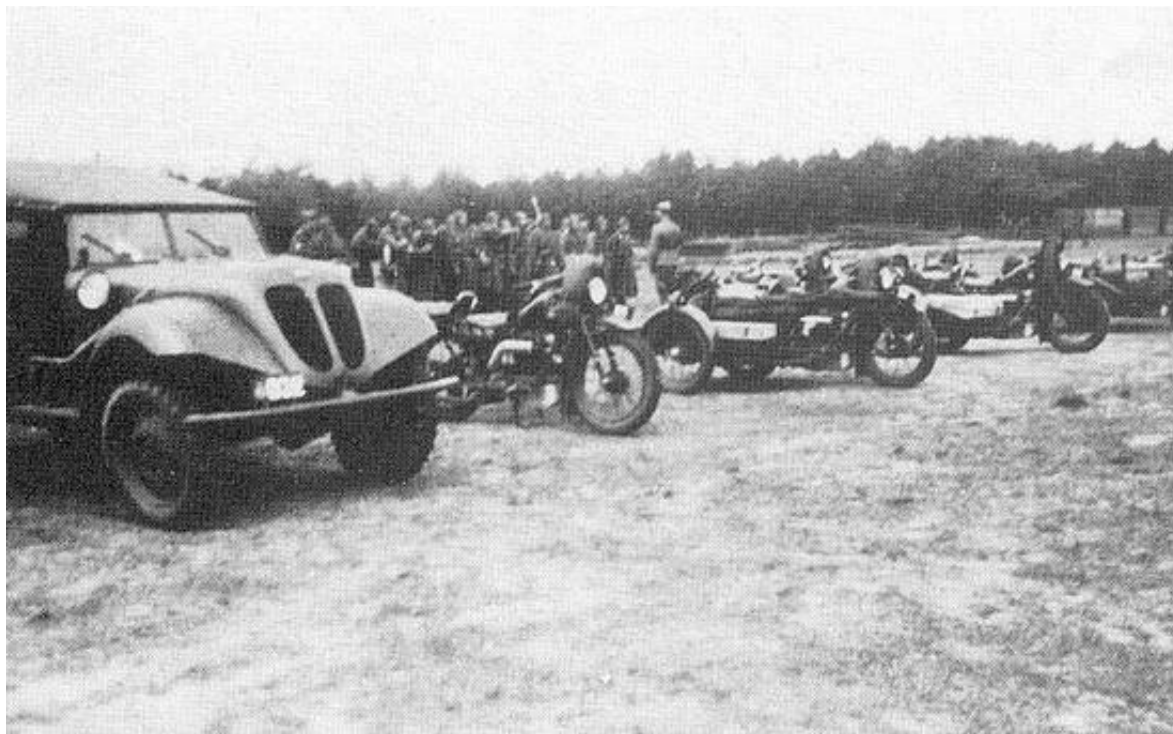
Skyts- eller motorcyklisteskadronen i Oksbøl 1939.

På billedet ses en af regimentets Tempovogne, en solomotorcykel samt mindst en kanonmotorcykel.