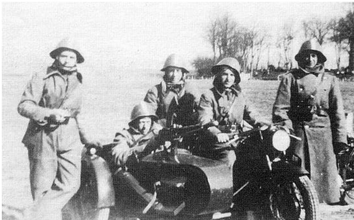
Øvelse med motorcyklisteskadronen ved Laurbjerg den 8. april 1940.