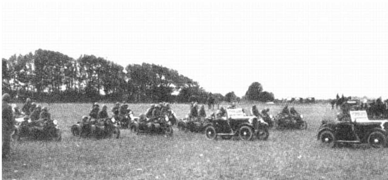
Motorcyklister fra Gardehusarregimentet, ca. 1937. Fra Kilde 2.