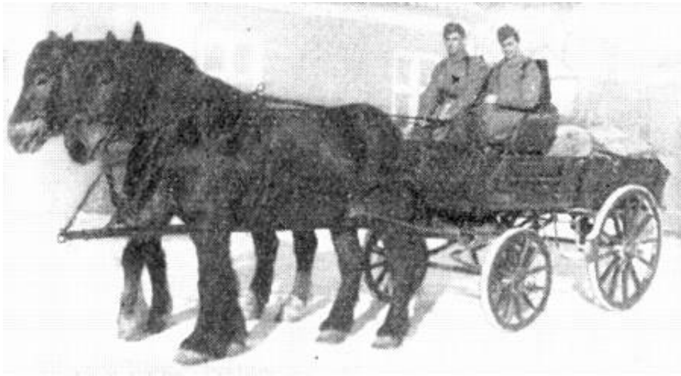
Trænvogn M.1909. Fra Kilde 3.

For billeder af karremateriellet se Del 2, 3 og 4.