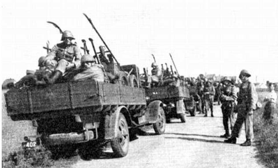
Maskingeværdelingens karremateriel læsset på lastvogne. Fra Kilde 5.

Ligeledes antydes det af funktionerne i kommandogruppen, at skytskompagniet rådede over motorcykler - muligvis en sidevognsmotorcykel til chef og/eller næstkommanderende samt en eller flere solomotorcykler til motorordonnanserne.