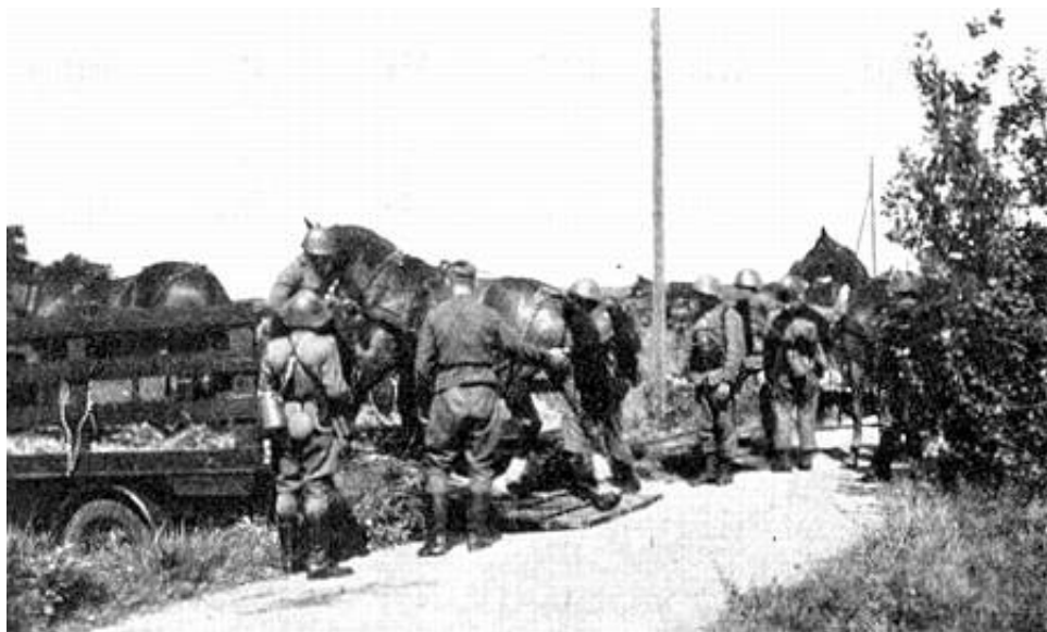
Hestetransport. Fra Kilde 5.

Er der behov for at fremføre skytskompagniet hurtigt og/eller over længere afstande, kan såvel mandskab som materiel fremføres på lastvogne.