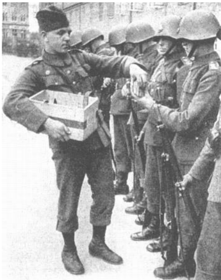
Ammunition uddeles til vagtmandskabet, Livgarden, ca. 1941 5 ).

272. Under kampen skal gruppeføreren nøje overvåge, at der drives forstandig økonomi med ammunitionen. Det er af særlig vigtighed, at der altid er tilstrækkelig ammunition i behold til rekylgeværet.