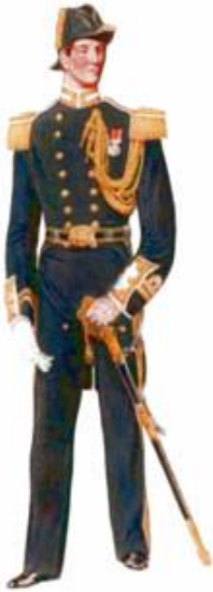
Flag-Lieutenant, Full Dress