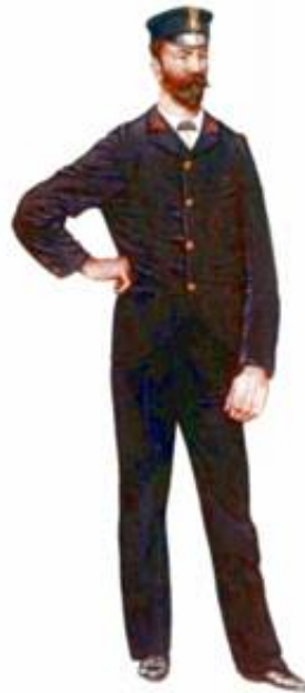
Chief Petty Officer

Illustrationer fra Stripes and Types of the Royal Navy 1 ), gengivet i Kilde 8.