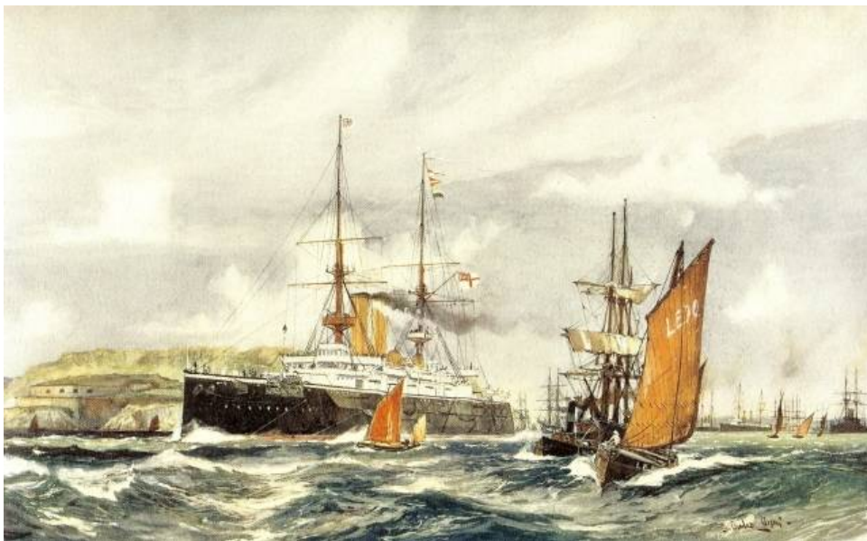
Krydseren HMS FORMIDABLE i Plymouth Sundet.

Britains bevarede graden Petty Officers på sine underofficersfigurer, til trods for den engelske marines ændring i grads-/uniformssystemet, hvorefter underkvartermestre var uniformeret som matroser, mens kvartermestre ( Chief Petty Officers ) var uniformeret som underofficerer. Tegningens underofficer er således Chief Petty Officer (kvartermester) af grad og Chief Armourer (våbenmekaniker) af funktion.