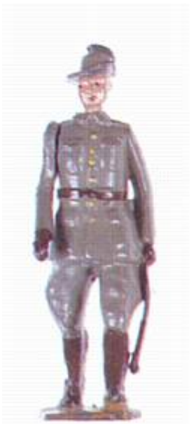
Britains katalognummer 1544: Australian Infantry, Service Dress, officer.

Ud fra et figurmæssigt synspunkt rummer figursættet det svaghed, at der ikke indgår en officersfigur. Ud over det viste eksempel på en indfødt officer, der stammer fra et sæt, der i dag er grænsende til det umulige at opdrive, må man som samler enten ty til at fremstille sine egne officersfigurer eller anvende passende figurer fra andre sæt.