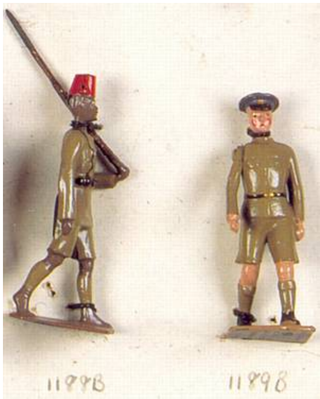
Britains katalognummer 2020: Portuguese East African Native Infantry. Fra Kilde 5.

Så vidt vides kom disse figurer aldrig i almindelig handel, men er enten fremstillet på bestilling eller prototyper til et planlagt, men aldrig introduceret figursæt.