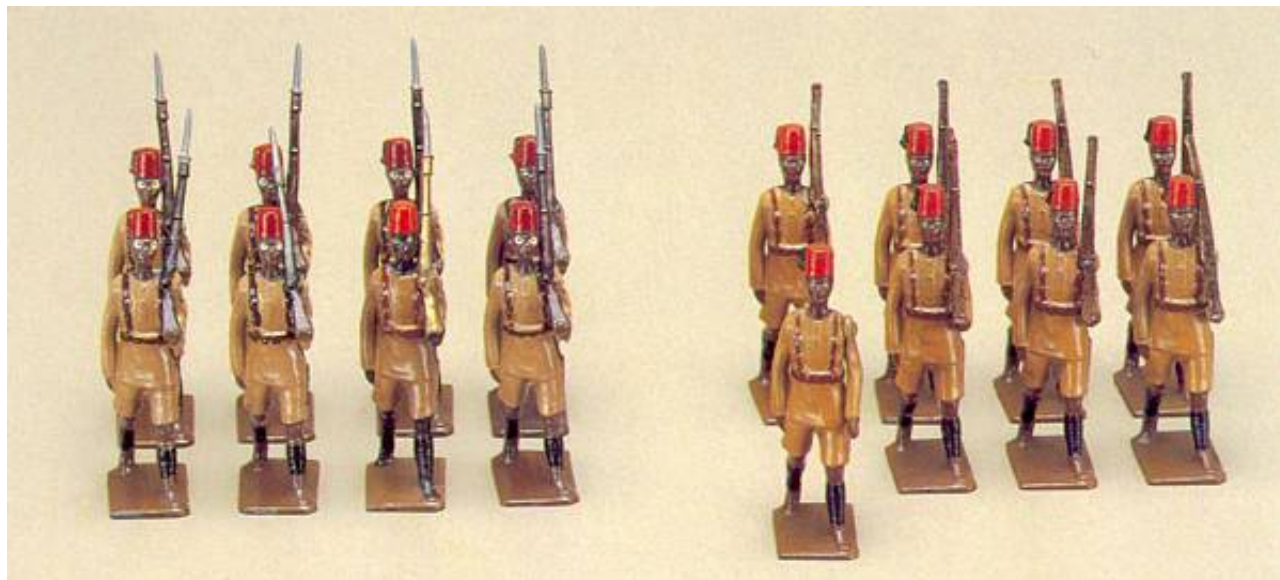
Britains katalognummer 225: King's African Rifles.

Figureerne så dagens lys i 1926 og er en ganske vellignende gengivelse af de indfødte afrikanske soldater. Se f.eks. min artikel Om King's African Rifles.