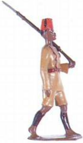
Britains katalognummer 225: King's African Rifles. Fra Kilde 4.

Sidstnævnte figurer er enten fremstillet på bestilling af en samler eller til salg hos f.eks. den store engelske legetøjsforretning Hamley's. Ud over de nævnte særlige forhold, er figurerne bemalet mere omhyggeligt, og de sorte øjne, på hvid baggrund, er knap så karikerede som på standardfigurerne.