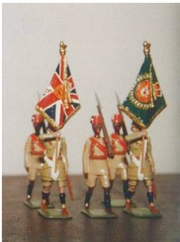
Et nærbillede af King's African Rifles faner.

At dømme efter disse og andre billeder, opnåede han glimrende resultater.