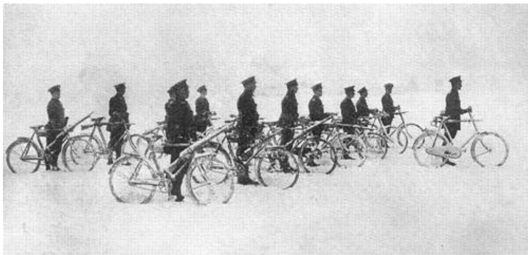
Men of The Cyclist Corps at Epsom, parading after a heavy fall of snow. Fra Kilde 4, som ikke nævner nærmere detaljer om enheden.

Hækkene og træet er som figurerne også hulstøbte - katalognummer (1922-1941) 521 Oak Tree og katalognummer (1922-1941) 526 Shrubs . Paradoksalt nok er disse dele fra den store landbrugsserie, som Britains påbegyndte i 1922 for at matche den stigende efterspørgsel af militært legetøj, der opstod som en reaktion på Første Verdenskrig.