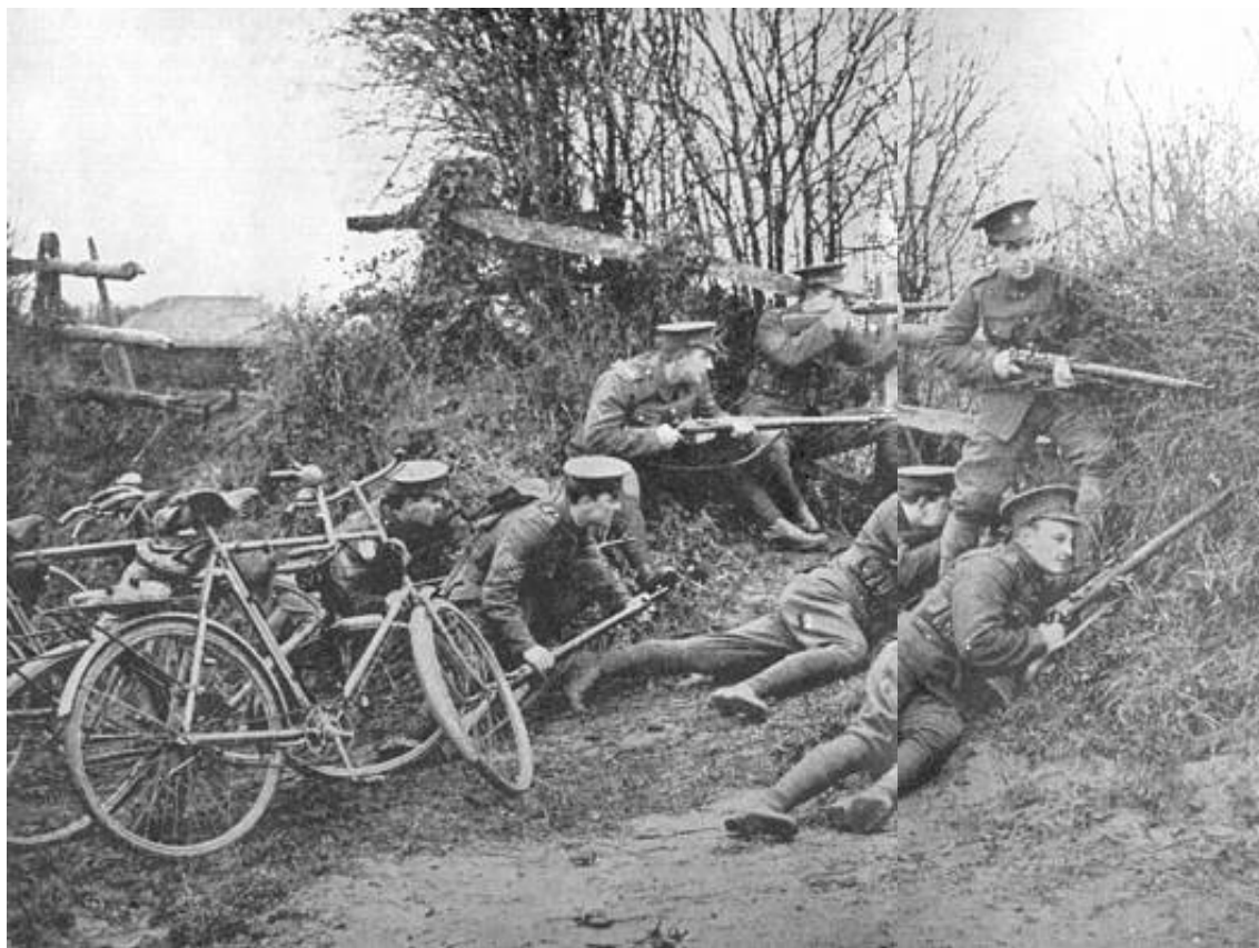
Engelske cyklister under uddannelse i England, ca. 1915. Udsnit af billede (gengivet over to sider) i Kilde 4, hvor teksten lyder: A patrol of cycle scouts laying in ambush under cover of a hedge.