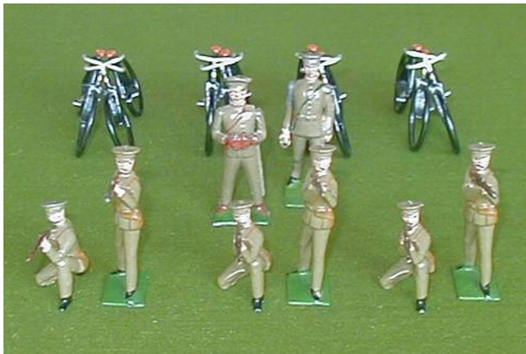
Et cyklistkompagni opstillet med figurer fra Britains og cykler fra Wm. Hocker.

Resultatet er en enhed på 8 figurer, organiseret i et føringslement (kommandodeling) og 3 cyklistdelinger. Skulle figurerne bruges á la krigsspilsenheder, ville de 3 cyklistdelinger være at betragte som opklaringsdelinger, der kan operere selvstændigt (egen kommando) 2 ).