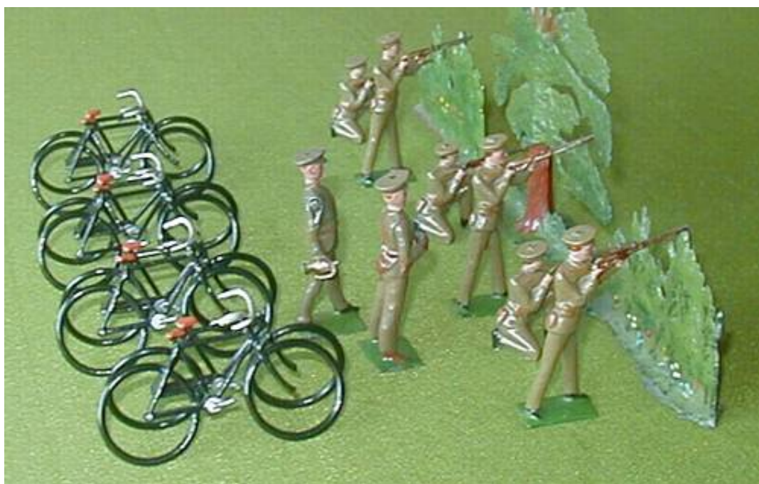
Et cyklistkompagni opstillet med figurer fra Britains og cykler fra Wm. Hocker.